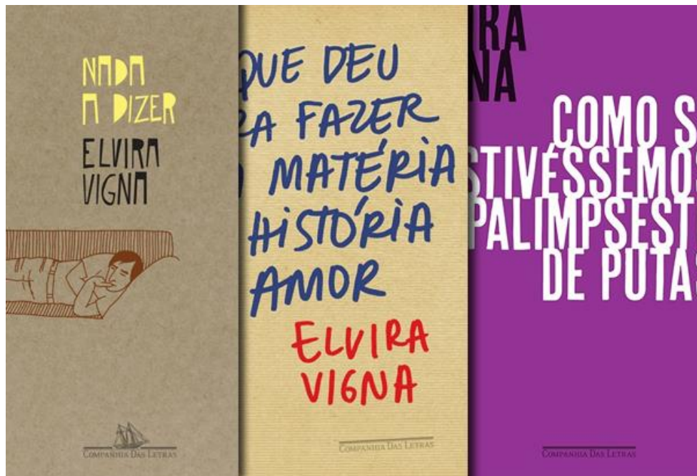
Imagens de capa dos romances corpus de análise desta tese.