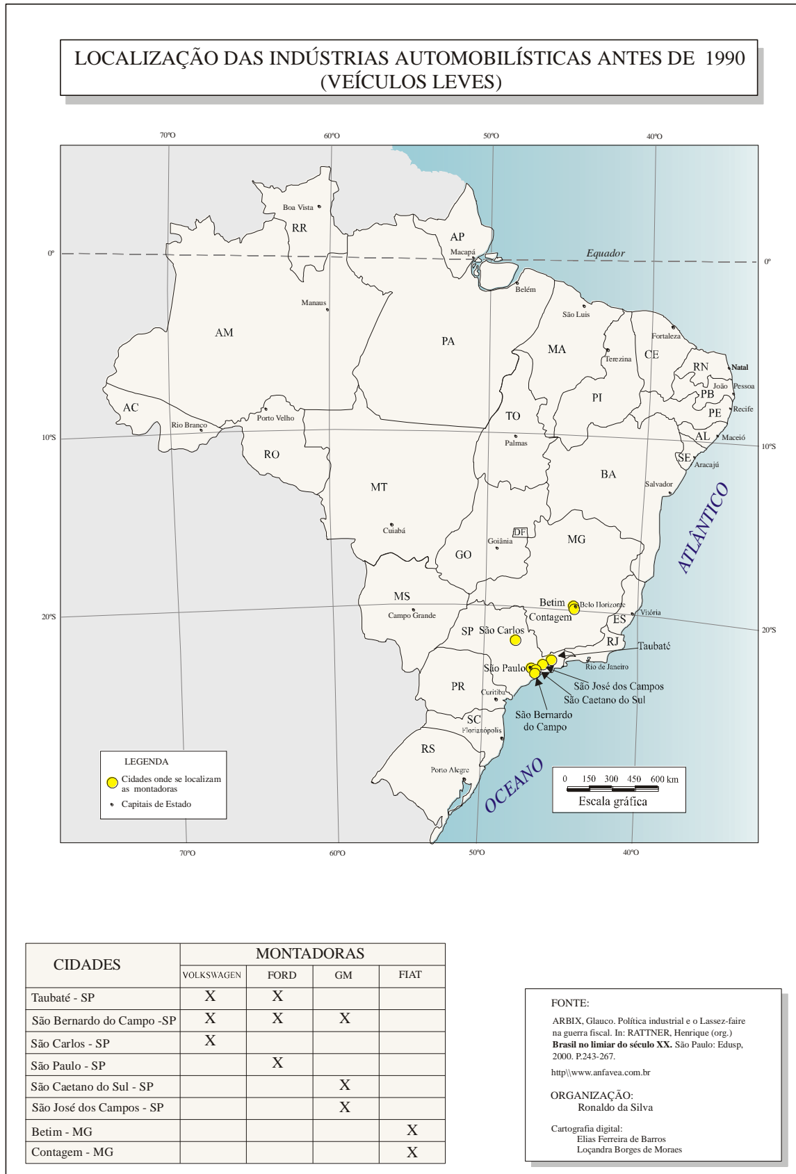
Figura 01 – Localização das indústrias automobilísticas antes de 1990 (veículos leves)