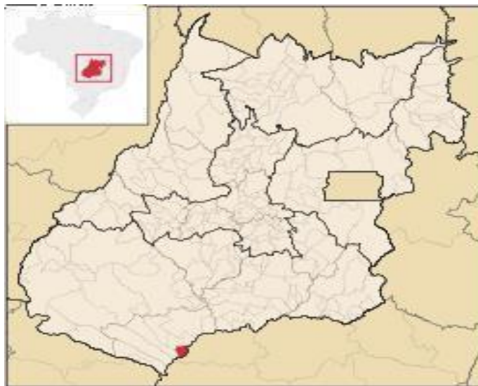
FIGURA 2. Imagem do Estado de Goiás e a localização do município de São Simão GO.