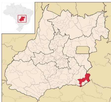
Figura 1. Localização do Município de Catalão no Estado de Goiás