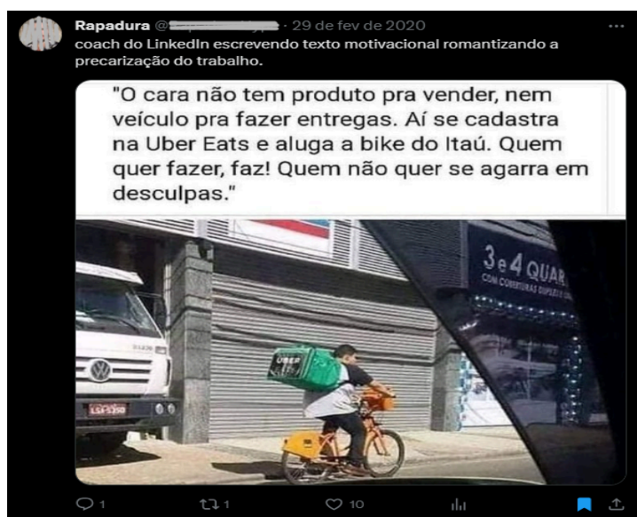
Figura 4 15

A partir da figura 4, podemos ter uma ideia da dispersão do discurso do coach profissional e sua relação com a racionalidade neoliberal, que defende a concepção de que basta querer que é possível “vencer” e a explícita tirania do mérito, evidenciada tanto na imagem quanto na frase: “quem quer fazer, faz! Quem não quer se agarra em desculpas”. A precarização das condições de trabalho é apresentada como esforço, dedicação, força de vontade. Vale destacar que essa captura de tela foi retirada de uma conta do twitter que está justamente fazendo uma crítica à postagem: “coach do linkedin escrevendo texto motivacional romantizando a precarização do trabalho”, indícios de uma possível contraconduta a tal discurso perverso.