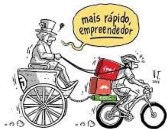
Imagem: Vitor Teixeira (2019) 1