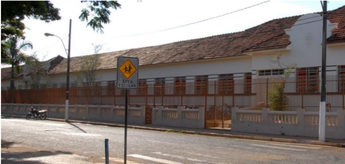
Imagem 2- Escola Estadual Sebastião Dias Ferraz em 2017