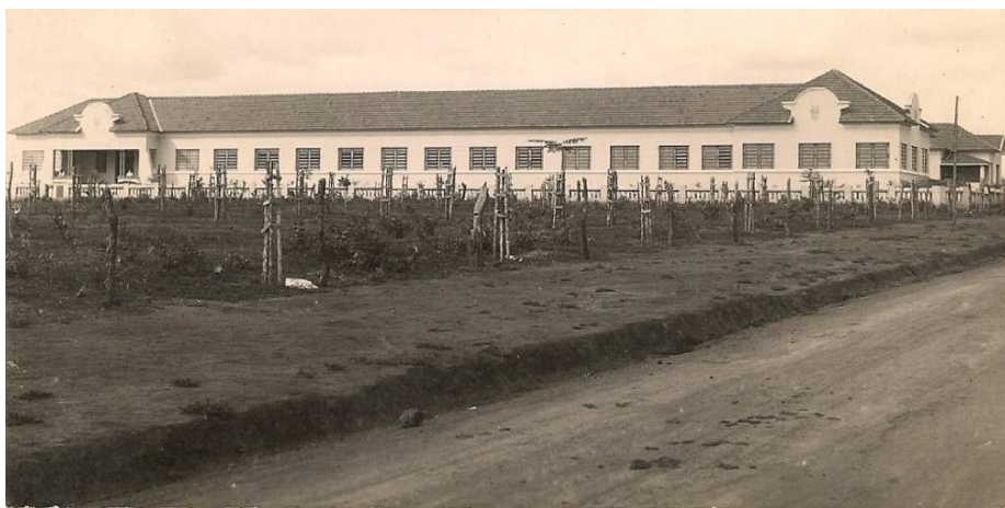
Imagem 1- Ginásio Tupaciguara em 1947

A instituição oferece as seguintes modalidades: Ensino Fundamental do 6º ao 9º ano e Ensino Médio do 1º ao 3ºano nos respectivos períodos manhã, tarde e noite e ainda a Educação de Jovens e Adultos. A escola possui aproximadamente 1.300 alunos e 114 funcionários.