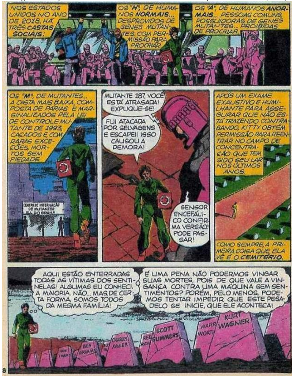
Figura 1 - Super Aventuras Marvel “Dias de Um Futuro Esquecido – X-Men” (1986)

consciência de Kitty para o passado, para que ela juntamente aos X-Men do século XX, evitem o assassinato do candidato à presidência Robert Kelly, pela mutante Mística, e assim impedindo que o futuro apocalíptico que os aguarda aconteça. Dias de Um Futuro esquecido , faz referência direta aos acontecimentos da 2ª Guerra Mundial, nos lembrando dos campos de concentração para Judeus, aqui utilizados para mutantes, comparando a humanidade como um grupo fascista, por não tolerar as diferenças e criar mecanismos para o extermínio de uma raça.