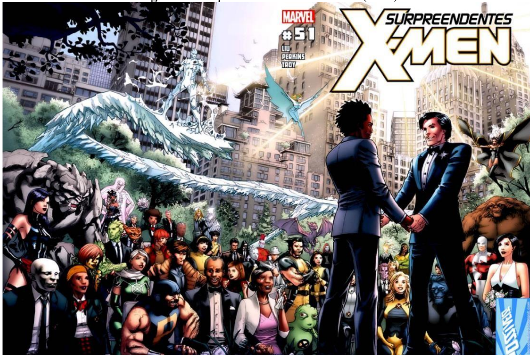
Figura 2 - Surpreendentes X-Men Nº 51 (2004)

Os personagens são outro elemento importante das HQs, uma história não é uma história sem personagens bem construídos para a narrativa. Eles devem ser bem pensados, contendo características físicas e emocionais que representem o que são, o desenhista pode representar o caráter de um personagem por exemplo, através de expressões e características humanas. O timing é outro elemento de extrema relevância na criação de uma história, é uma técnica de captura sequencial de quadros, definidos pelo tempo e ritmo que é transmitida a ação. A disposição dos quadros e os balões fazem a diferença na história.