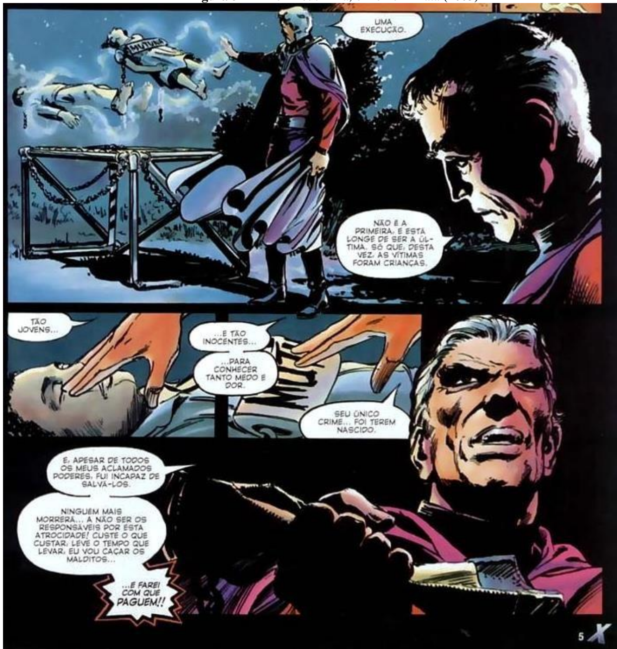
Figura 3 - X-Men Deus Ama, o Homem Mata (2003)

Em Deus Ama, O Homem Mata (2003) os X-Men mais uma vez são alvo do ódio dos humanos, para com a raça mutante. Desta vez, liderados pelo reverendo William Stryker, um grupo de extermínio, intitulado Purificadores, começa a assassinar mutantes, inclusive crianças com o gene X desperto, que os faz também mutantes. Mas o plano de William vai além, sua intenção é o extermínio global da raça mutante, para isso ele precisa da mente mais poderosa, a do Professor X.