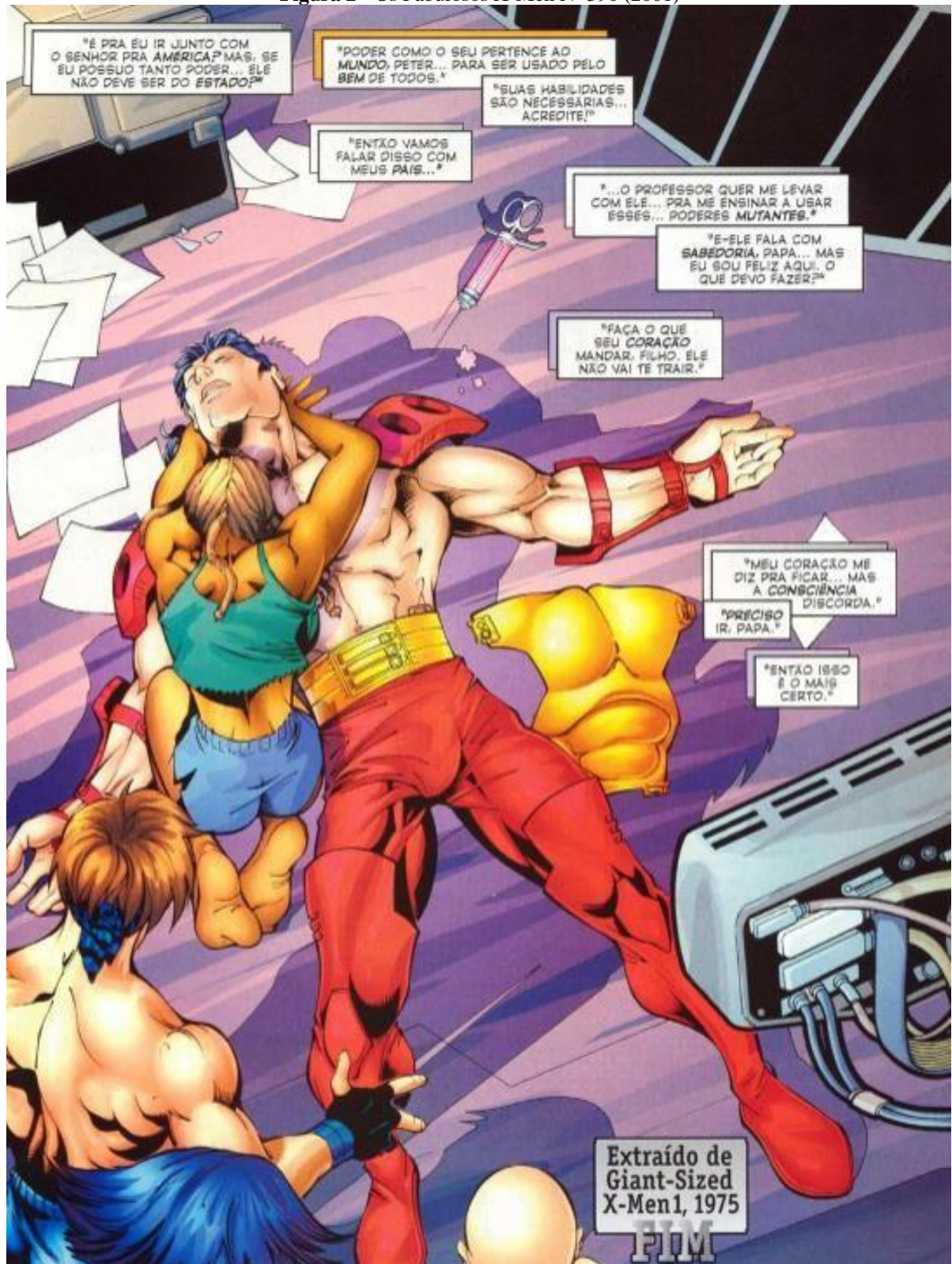
Figura 2 - Os Fabulosos X-Men Nº 390 (2001)