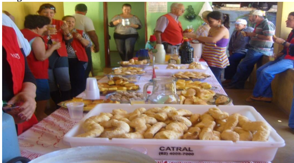
Imagem 23: Café da manhã.