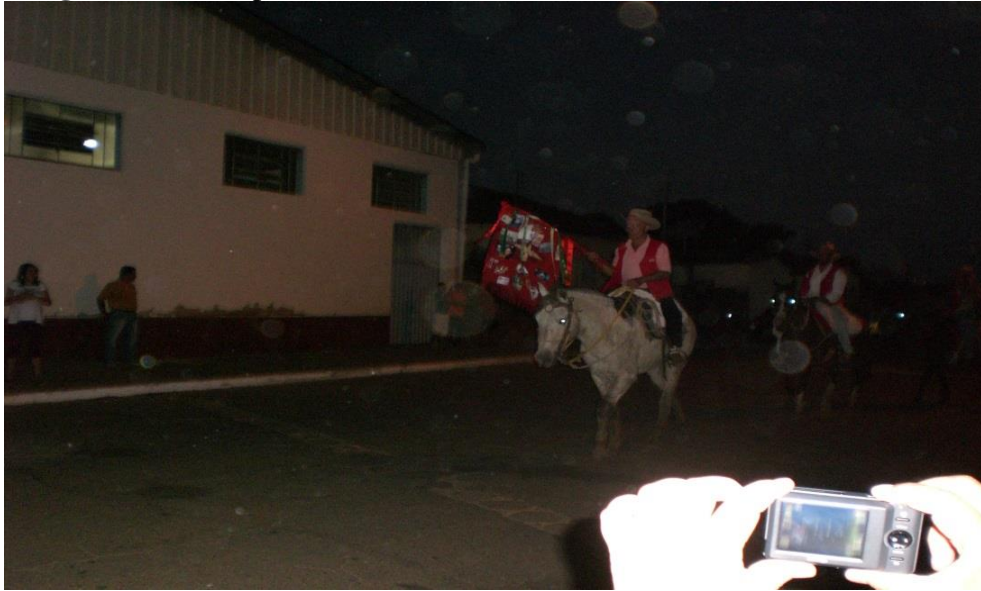
Imagem 28: Saída para encerramento e hasteamento da bandeira.