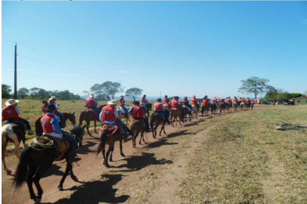
Imagem 43: Os giros.