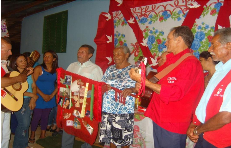
Imagem 31: Contra-guia, Violeiros e Ajudante do Cantador.