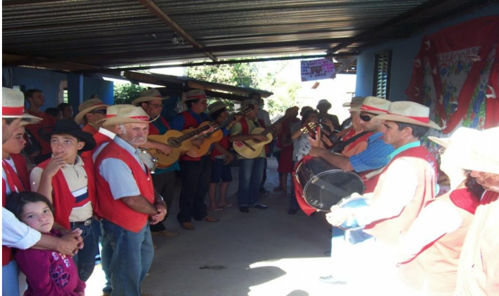
Imagem 19: Agradecimento pela refeição antecede o Terço.