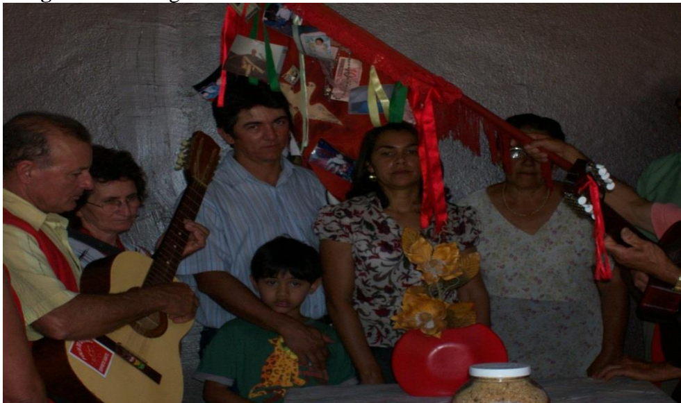
Imagem 16: Entrega da bandeira aos anfitriões.