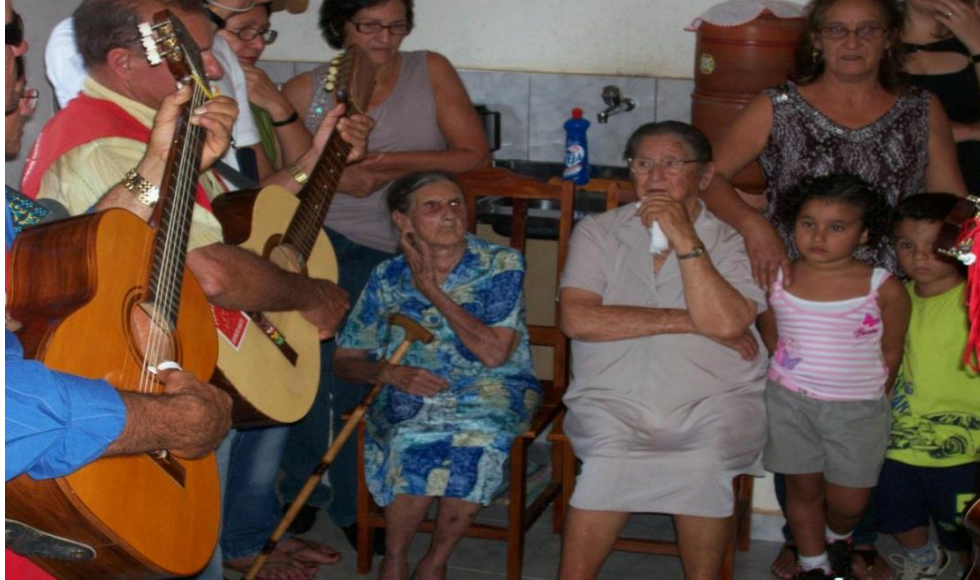
Imagem 13: Visita em Giro na casa de devotos.