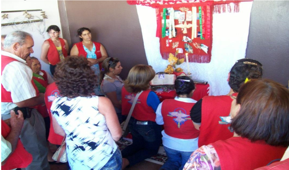
Imagem 14: Momento de encerramento da saudação do altar.