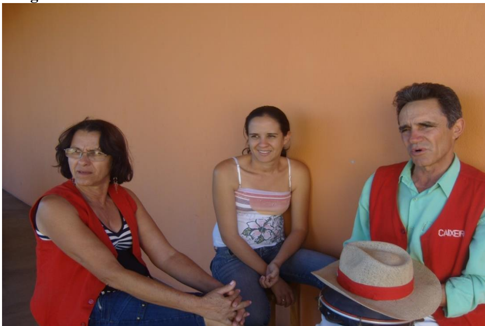
Imagem 32: O Caixeiro.