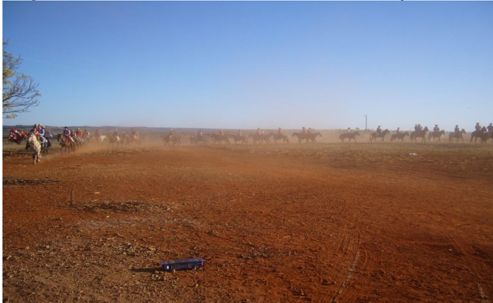
Imagem 26: No último dia os cavaleiros formam um belo coração