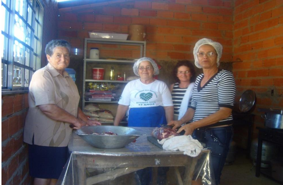
Imagem 06: Preparativos para a Folia; mulheres preparando iguarias da festa.