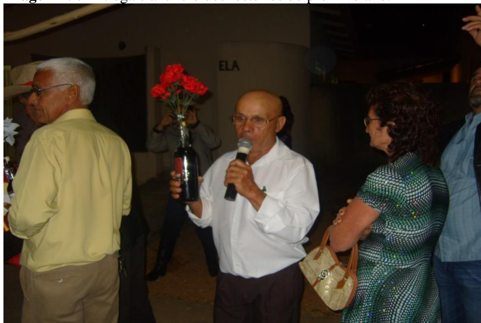
Imagem 29: Entrega e anúncio dos festeiros do próximo ano.