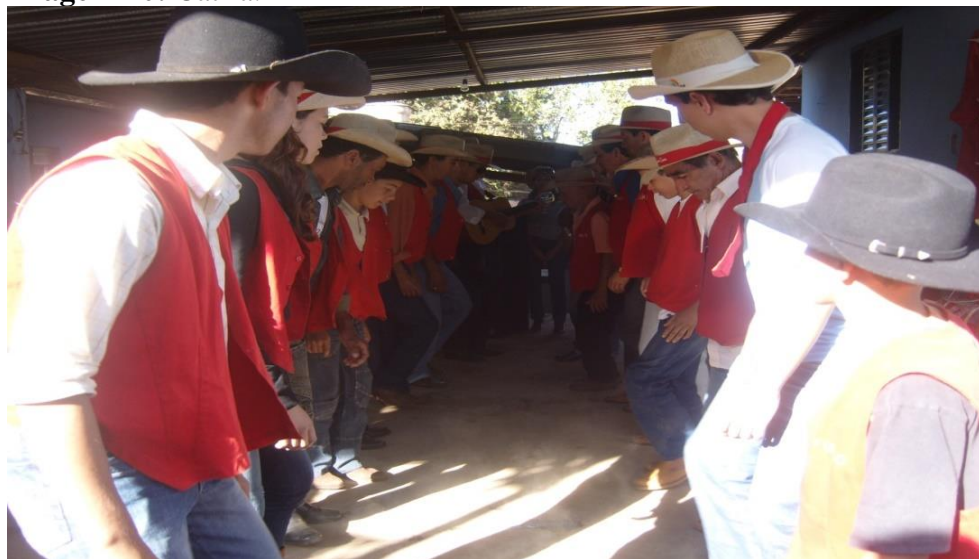
Imagem 20: Catira.