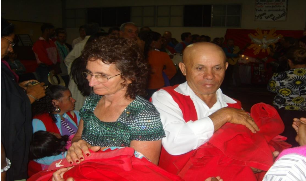
Imagem 24: Entrega das divisas.