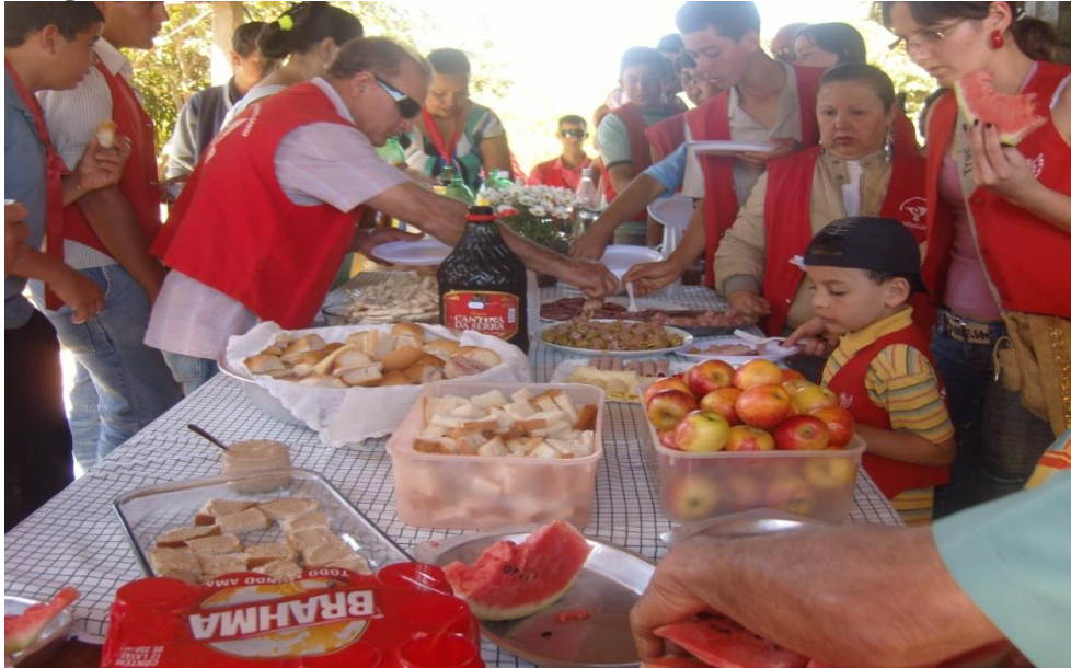
Imagem 40: Café da manhã.