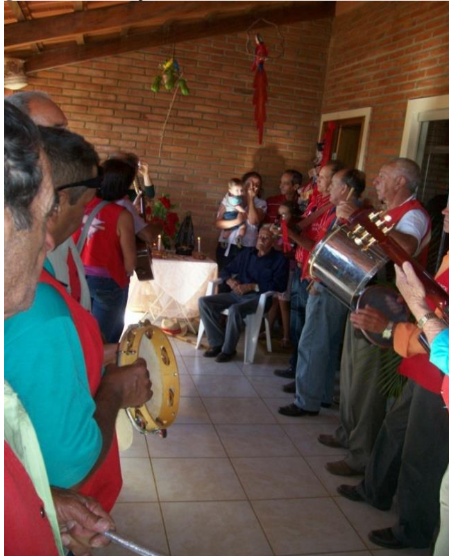
Imagem 07: Entoação de cânticos ao som de instrumentos.