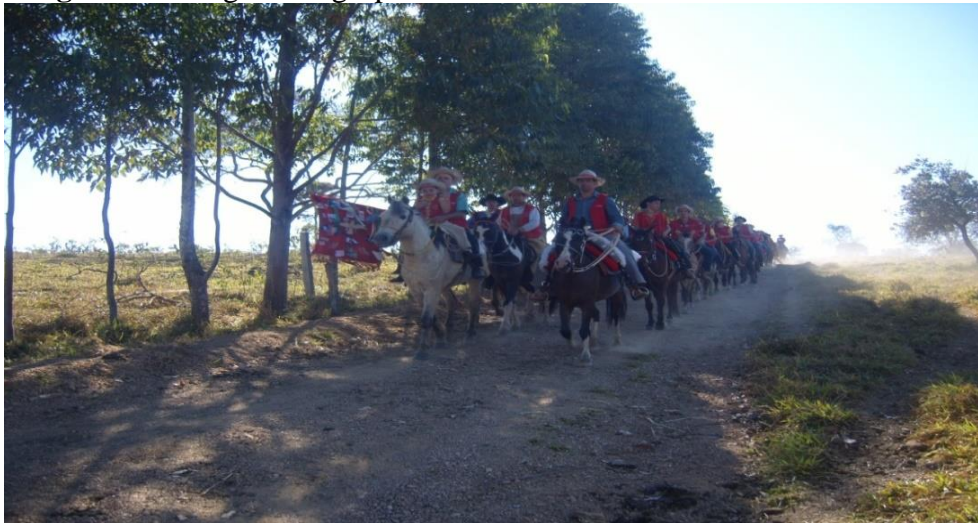
Imagem 12: Chegada do grupo.