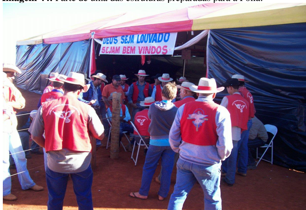
Imagem 44: Parte de uma das estruturas preparadas para a Folia.