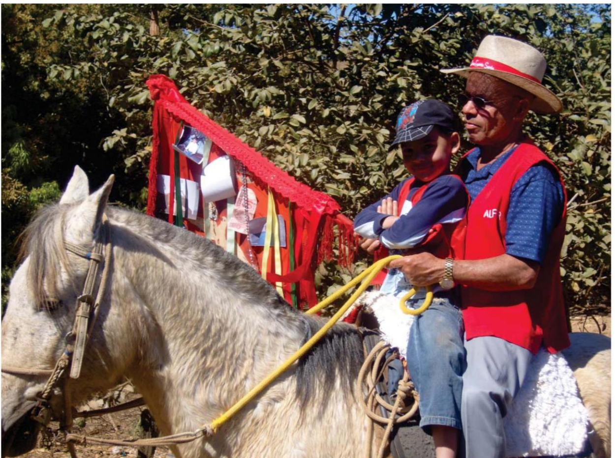
Tradição das Gerações (Avô e Neto)