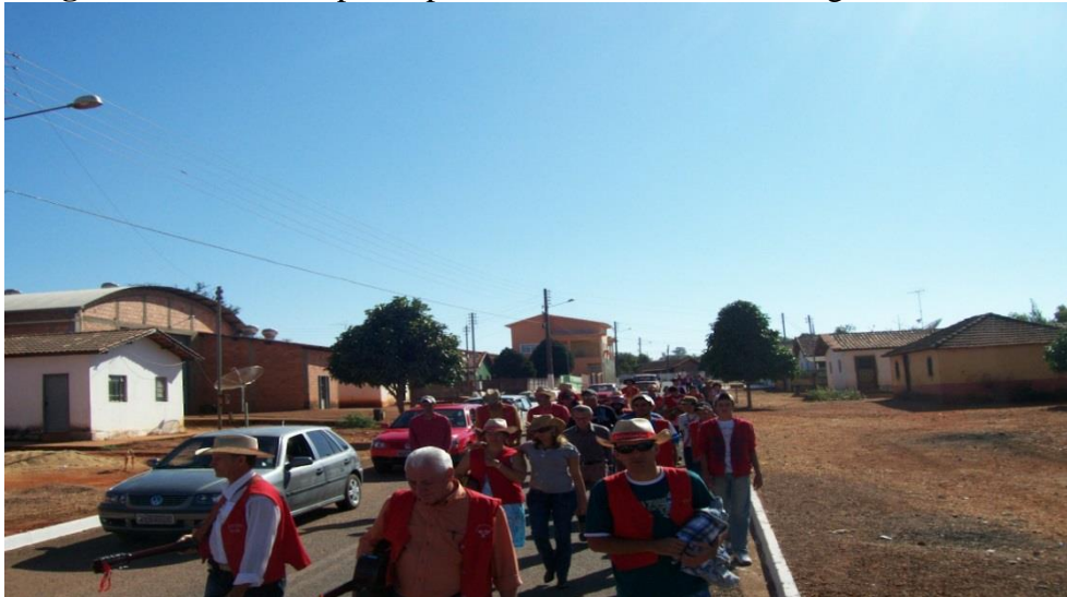
Imagem 22: Devotos e participantes da alvorada do domingo.