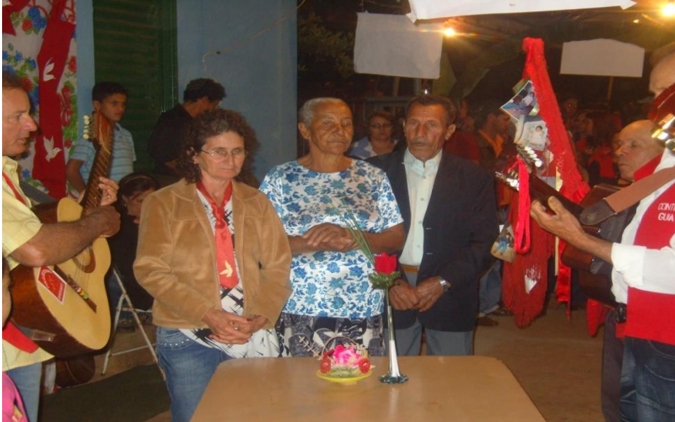
Imagem 17: Agradecimento pela refeição.