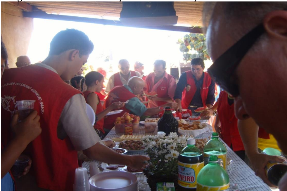
Imagem 41: Momento de refeição coletiva e interação social.