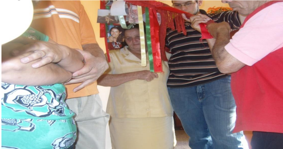
Imagem 15: Momento da Bênção.