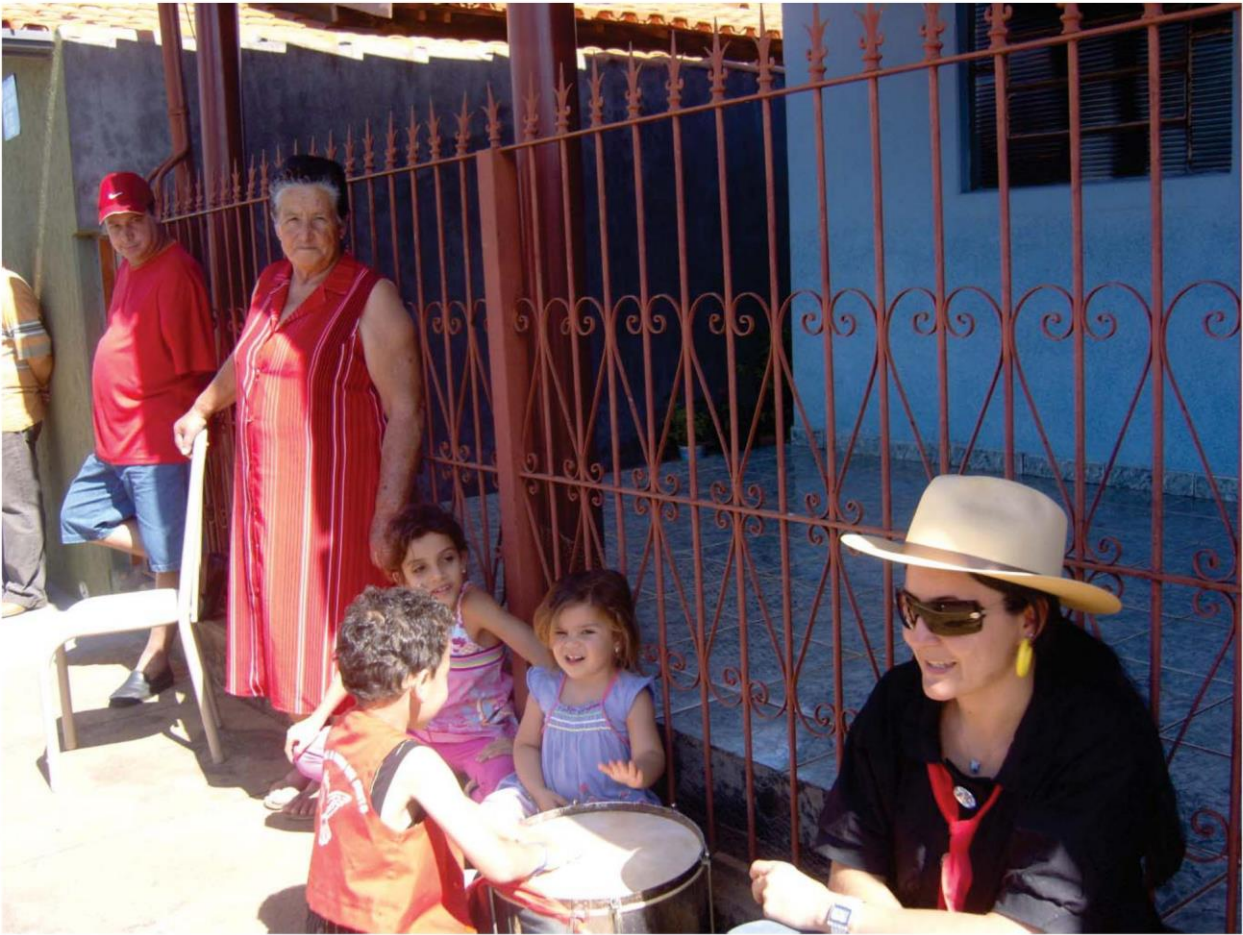
A tradição continua