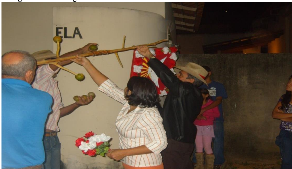
Imagem 27: Entrega