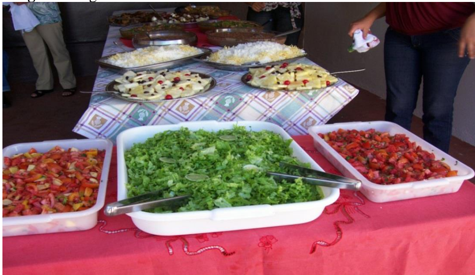
Imagem 42: Iguarias servidas nos dias de Folia.