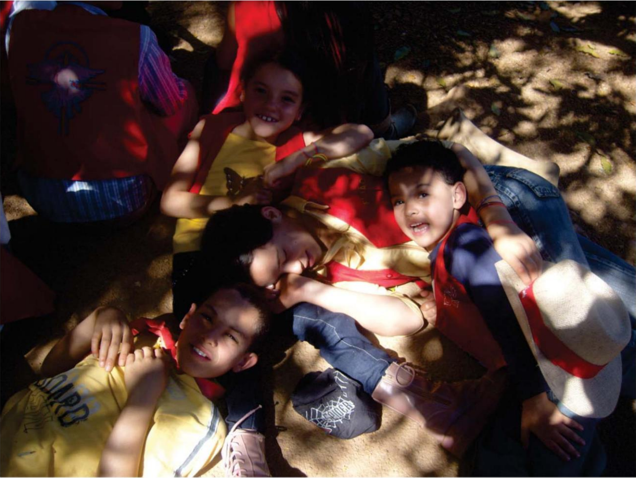
O futuro da Folia