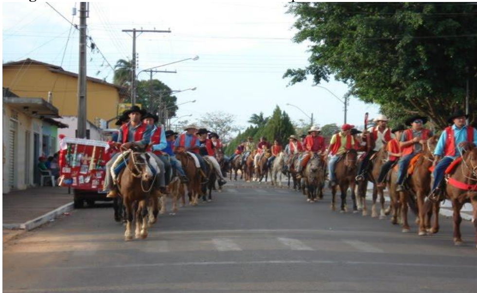
Imagem 10: Giro da Folia. Cavaleiro à frente portando a bandeira.