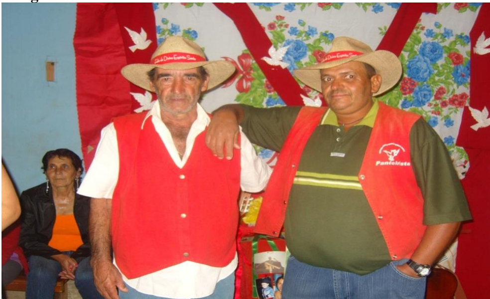
Imagem 34: Pandeirista.