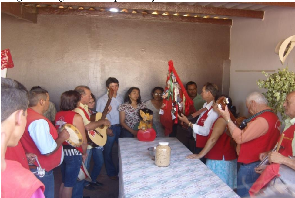
Imagem 18: Agradecimento pela refeição em forma de cânticos.