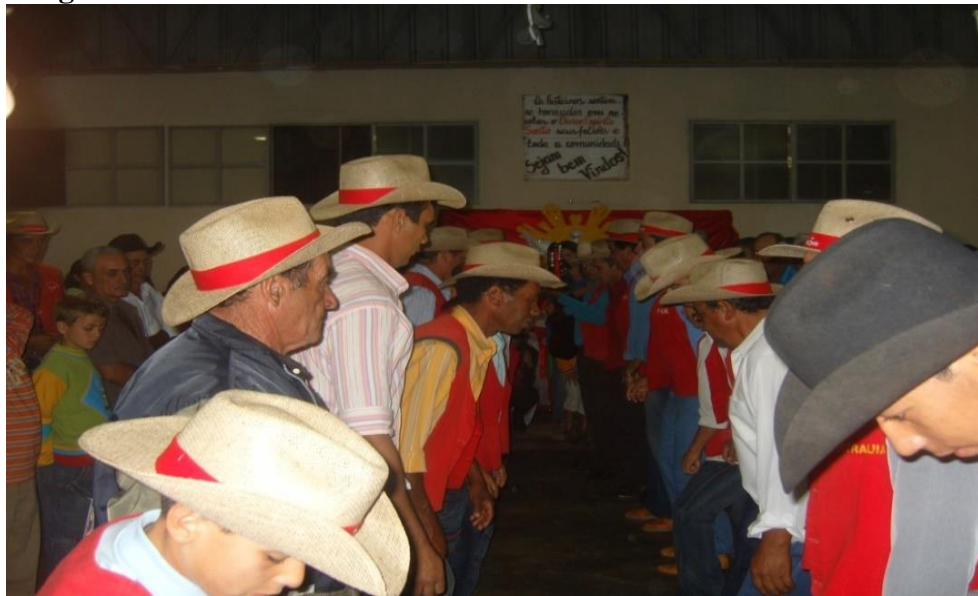
Imagem 35: Catireiros.

Fonte: Acervo do Sr. José Dourado (2008).