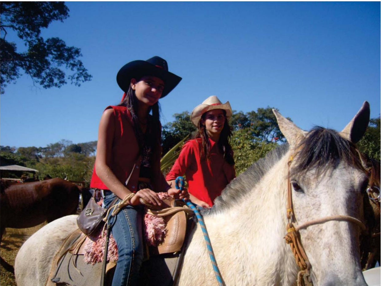
Participação das mulheres na Folia