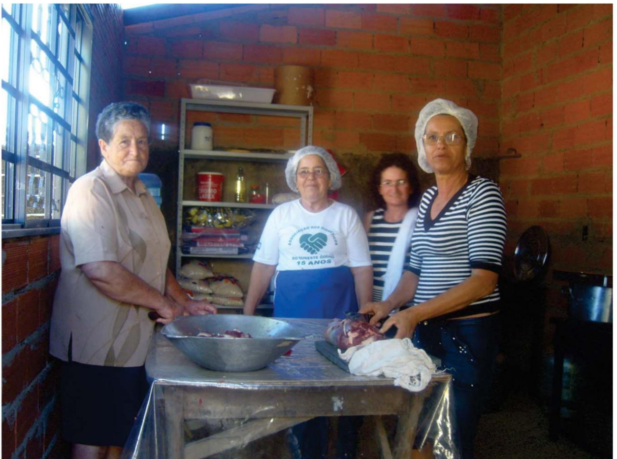
Preparativos do Pouso de Folia