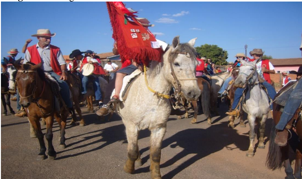
Imagem 25: Chegada da Folia.