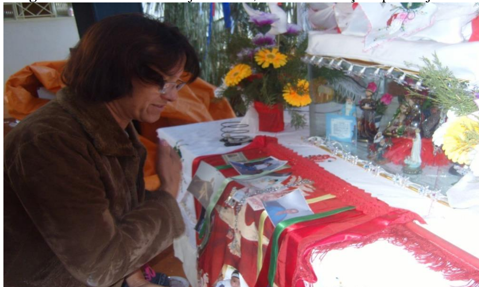
Imagem 09: Reverência e beijo no altar; devota em oração após beijar o altar.