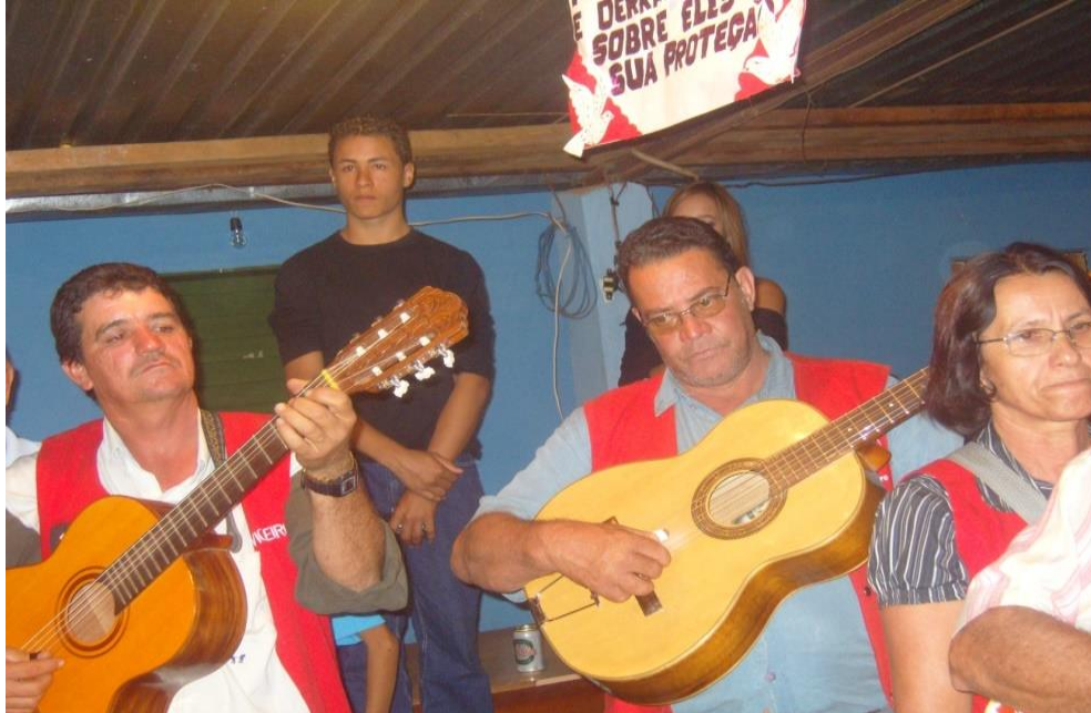
Imagem 33: Violonistas.