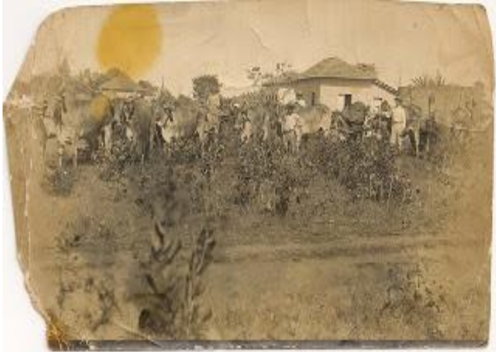
Imagem 03: Pouso de tropeiros/boiadeiros, “Calaça”.