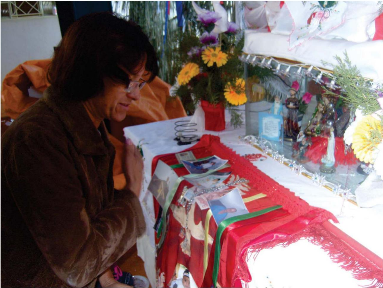
Beijo no Altar