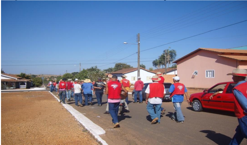
Imagem 11: Percurso do Giro da Folia; devotos a pé.