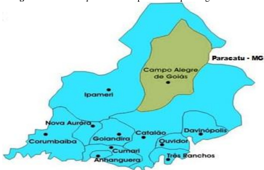
Imagem 02: Localização do município de Campo Alegre de Goiás-GO.

Fonte: http://gentedecampoalegredegoias.blogspot.com.br/p/historia.html (28/10/2016).