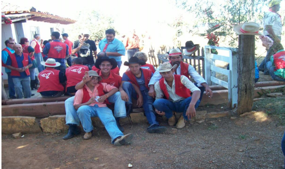
Imagem 01: Um dos diversos momentos de sociabilidade durante os festejos.