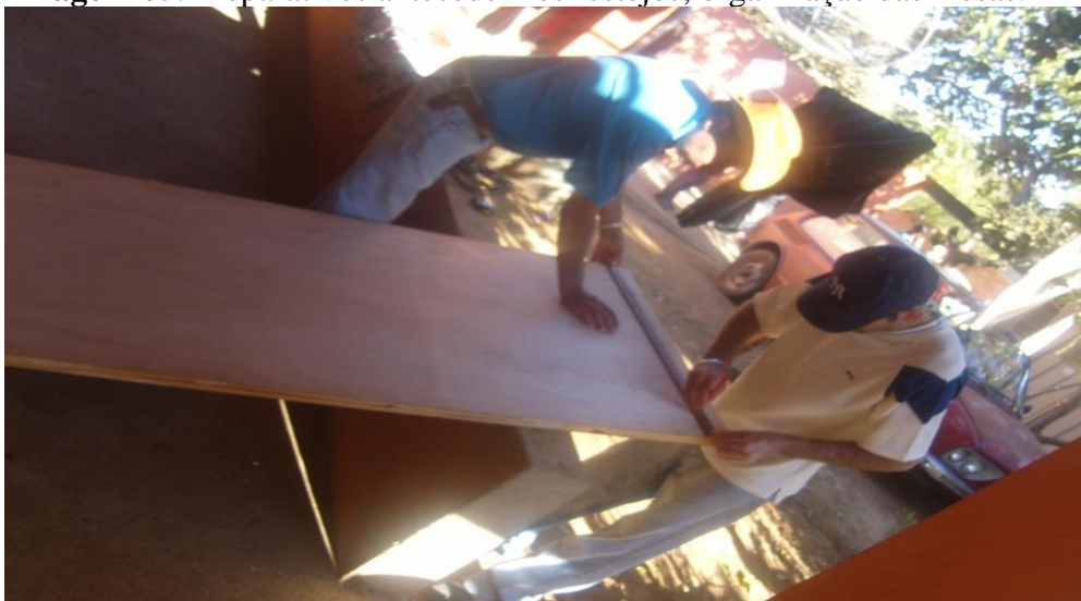
Imagem 05: Preparativos antecedem os festejos; organização das mesas.

Fonte: Acervo do Sr. José Dourado (2008).