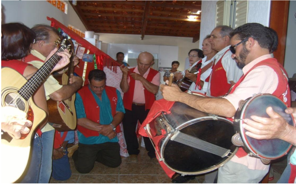
Imagem 08: Momento da entoação do hino e rezas.