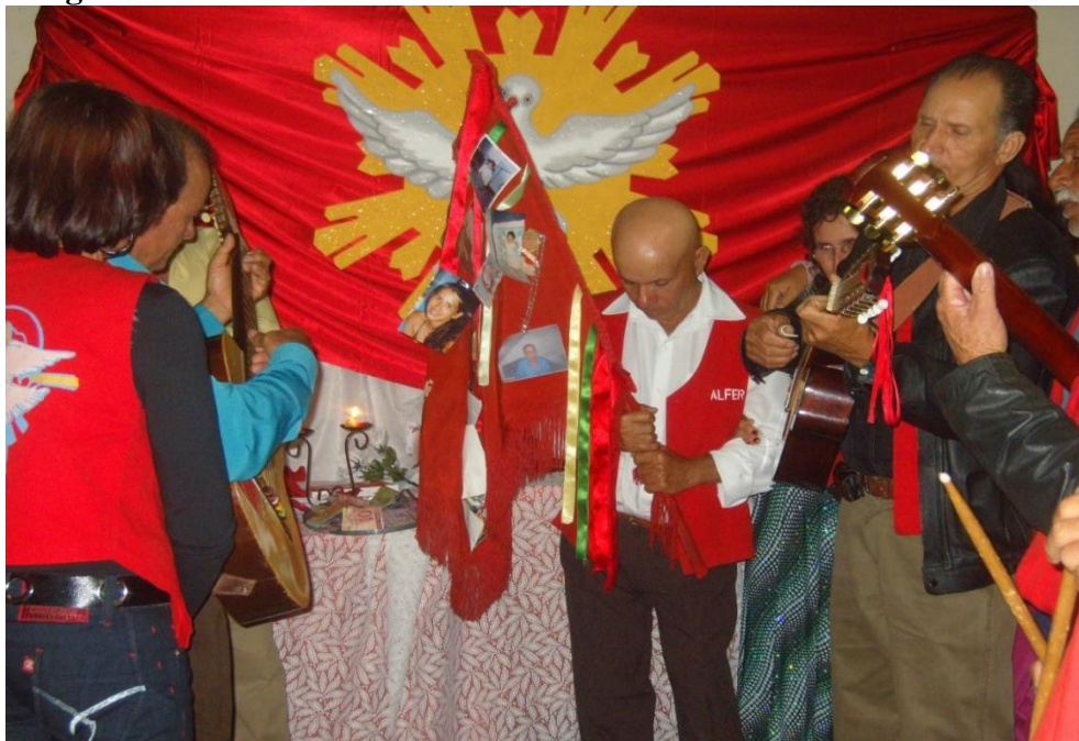
Imagem 30: Alferes.