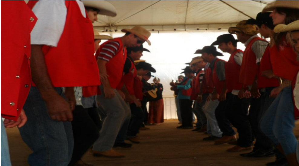
Imagem 21: Dança da catira.