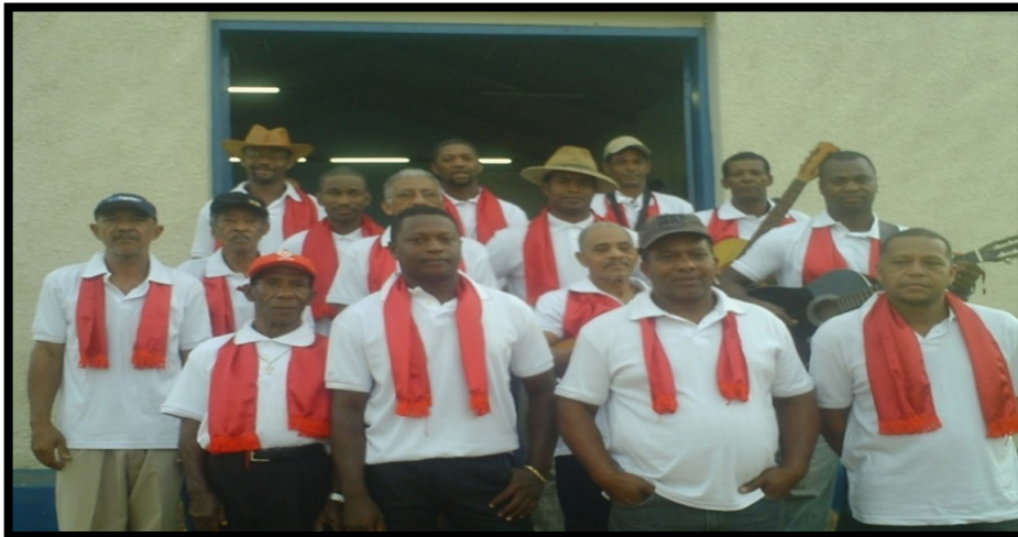
FIGURA 16: Moradores responsáveis pelas cantigas e reza de São João

Essa festa, mesmo se limitando à pequena comunidade é assistida por muitas pessoas de outras localidades que veem com bons olhos o esforço do grupo para manter e repassar a tradição a seus descendentes. Os assistentes conseguem sentir a importância que todos da comunidade atribuem ao evento e como se sentem orgulhosos de ter a Caretagem como representante legítimo da cultura do grupo.