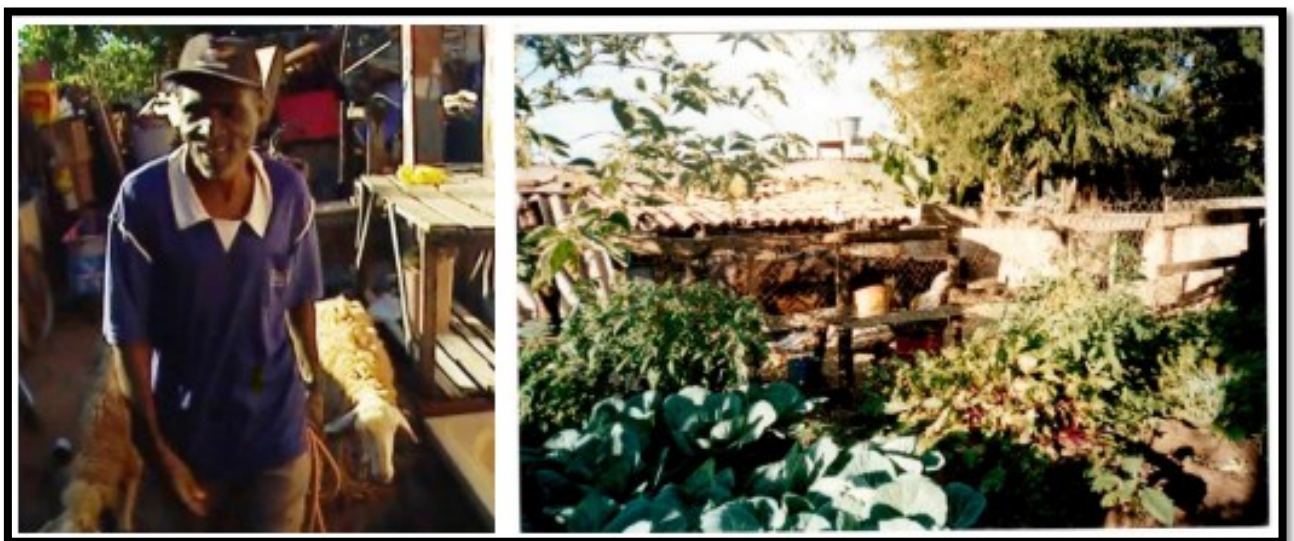
FIGURA 4: Integrante da Comunidade dos Amaros