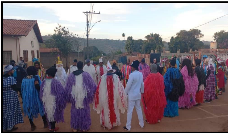
FIGURA 20: Concentração dos caretas antes de iniciar a Caretagem

Neste ano de 2023, participaram 40 caretas, sendo 20 vestidos com roupas masculinas e 20 femininas. A festa começou às 19 horas com a celebração da missa na igreja local, pelo padre responsável pela Paróquia de um bairro vizinho. Da missa, participam os moradores do povoado, visitantes e todos os participantes da Caretagem, que agradecem pelas bênçãos recebidas no ano que passou. Neste momento, o padre reafirma a fé do povoado pelo santo louvado naquela noite. Após a missa, começa a Caretagem que, até a manhã seguinte, visitou 15 residências, terminando no dia 24 ao meio dia, após o almoço servido na última residência visitada. Ainda comenta que o Capitão deve exercer sua autoridade amigavelmente, mantendo a ordem e fidelidade aos costumes, inclusive vigiando para que nenhum participante tire a máscara durante todo o trajeto e para que não seja servida bebida alcoólica aos foliões nas casas onde dançam.