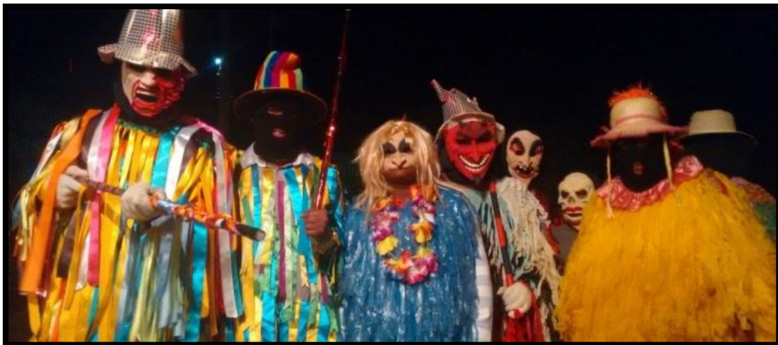
FIGURA 17: Caretas prontos para a dança

A Figura 17, abaixo, retrata alguns ‘caretas’, membros da Caretagem, devidamente fantasiados e prontos para iniciar uma longa noite de danças e festejos.