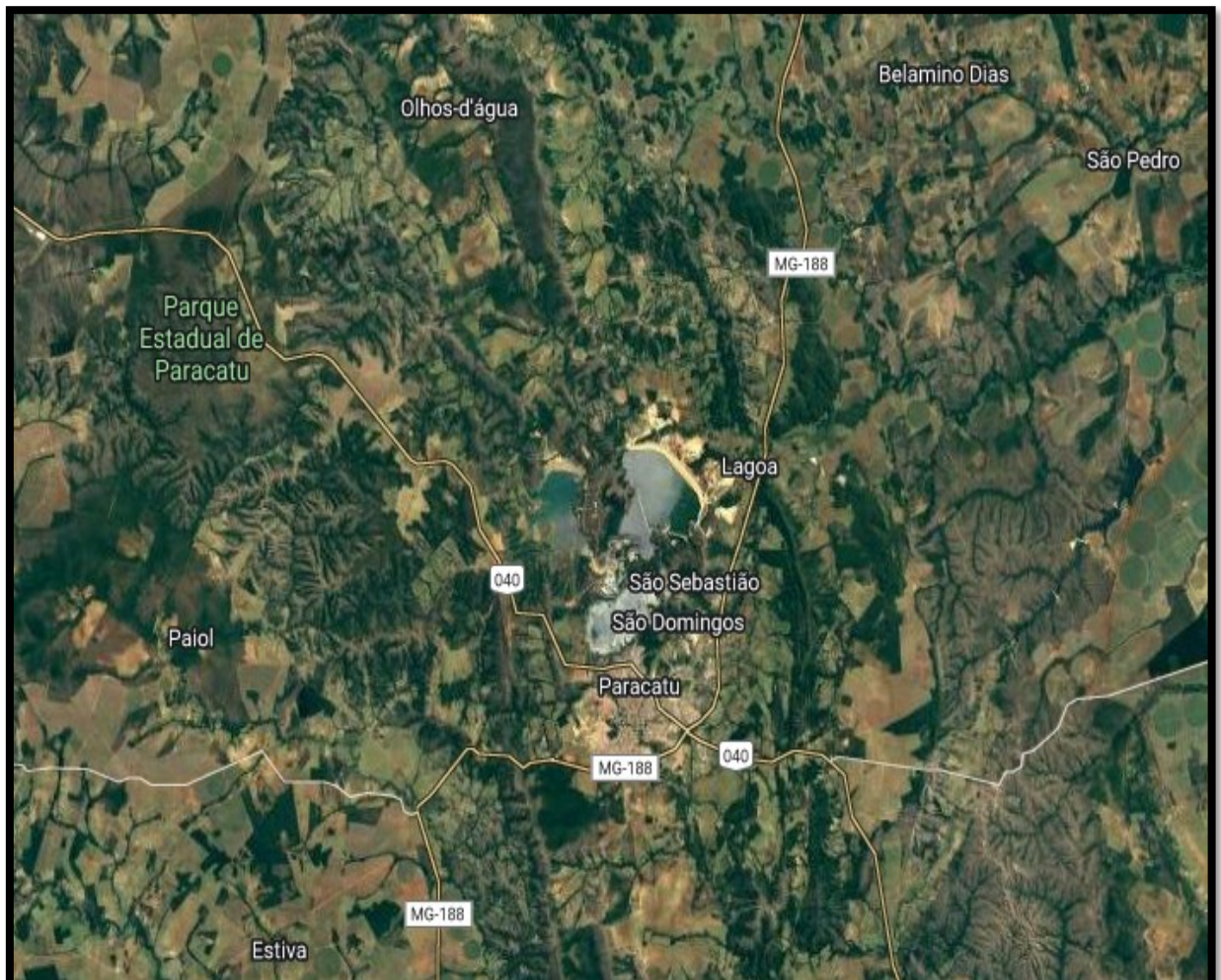
FIGURA 7: Vista aérea da localização geográfica do Povoado de São Domingos

Como se vê na Figura 7, o povoado de São Domingos está situado muito próximo de outro povoado, chamado São Sebastião e da área urbana, apenas 3km. Localiza-se a 710m de altitude; latitude sul 17°13'1'', longitude oeste, 46°52'17''.