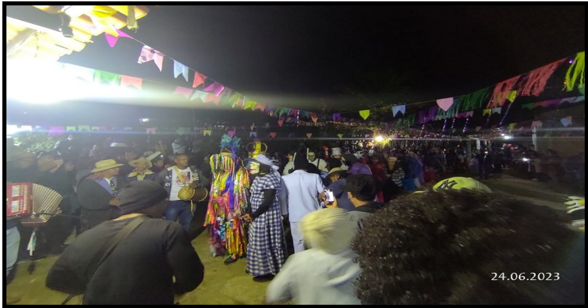
FIGURA 22: Chegada da Caretagem em uma das casas