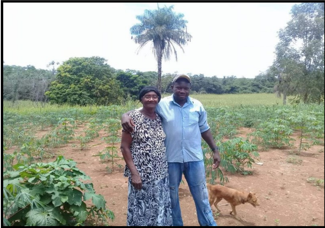
FIGURA 5: Membros da Comunidade do Cercado e plantio de mandioca e quiabo