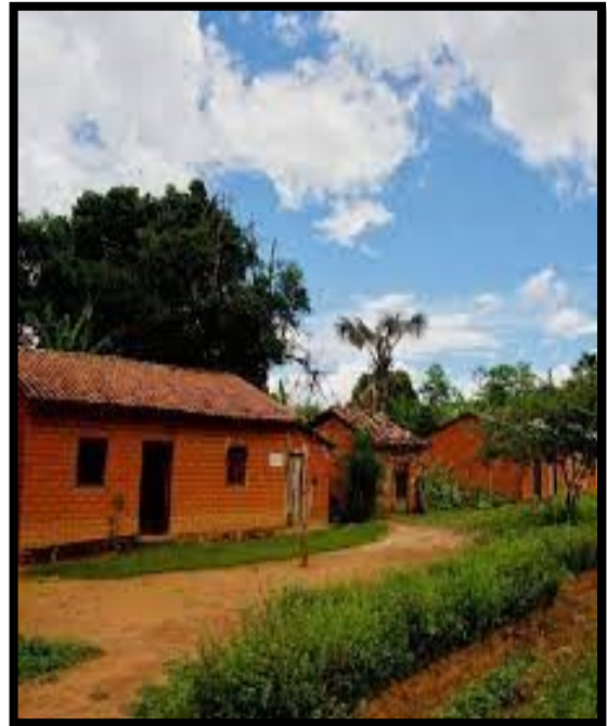
FIGURA 13: Casas locais mais antigas