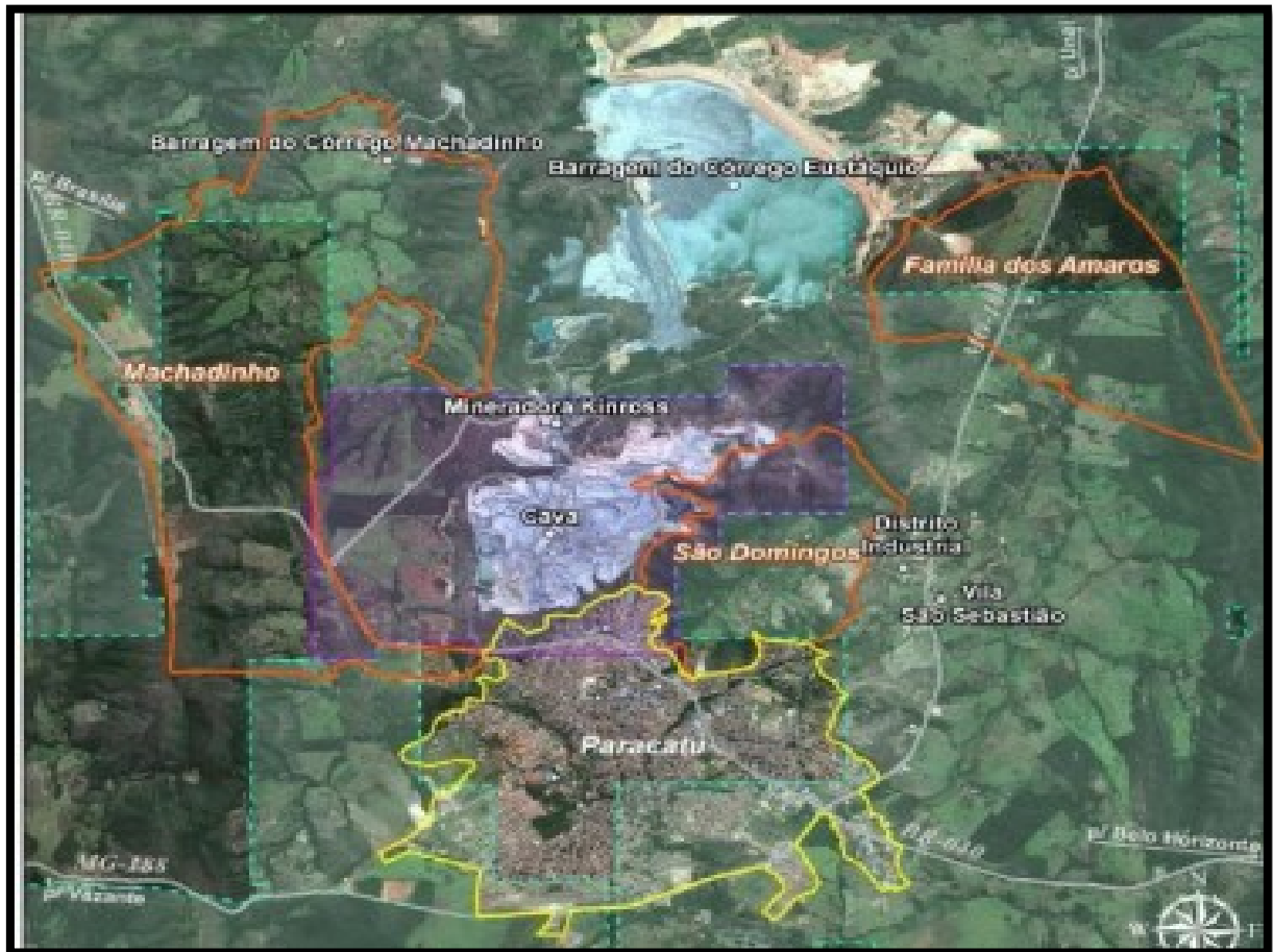
FIGURA 3: Localização das Comunidades Quilombolas em Paracatu-MG