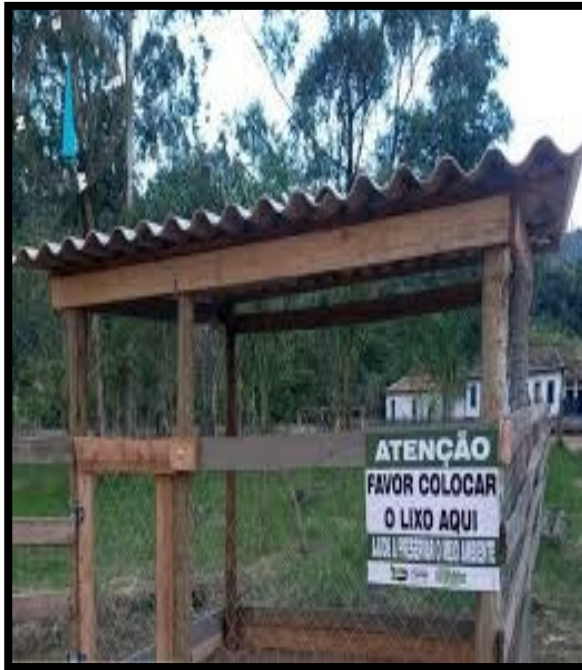
FIGURA 12: Posto de coleta de lixo comunitário