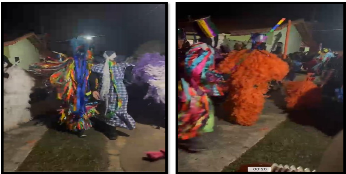
FIGURA 23: Evolução dos caretas

O primeiro passo é chamado batuquim . Os cavalheiros e damas caminham entre si, formando um caracol, em seguida, uma roda e depois, um círculo duplo formado por duas filas: uma de cavalheiros (círculo externo) e a outra de damas (círculo interno). Em seguida, os casais se juntam novamente e está aberta a Caretagem.