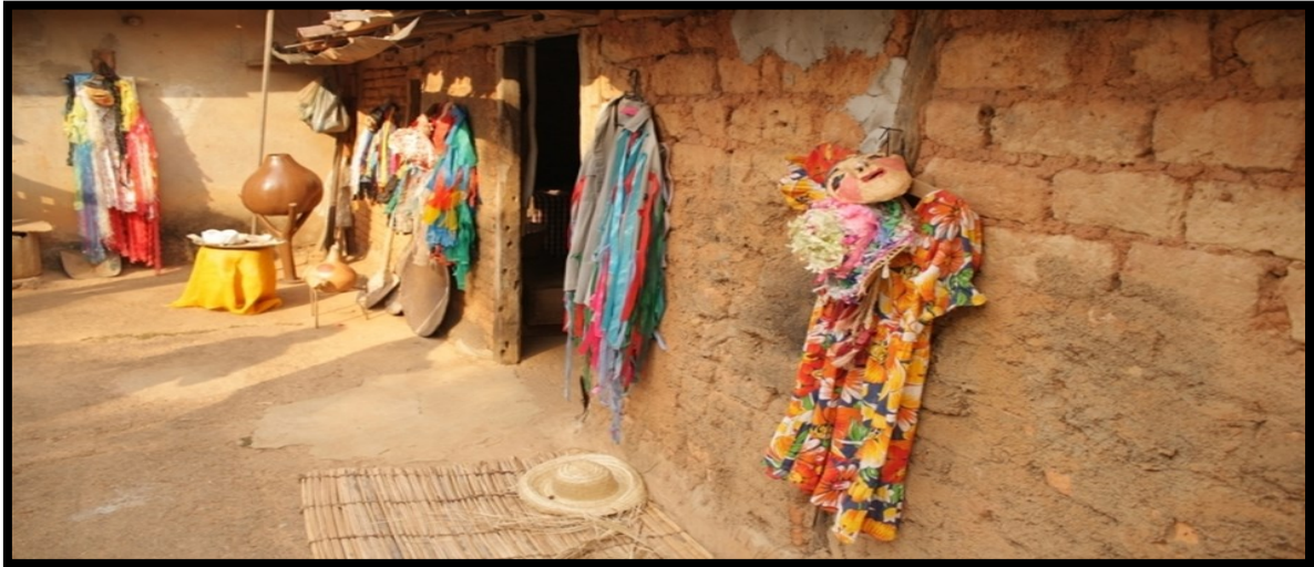
FIGURA 15: Casa onde são fabricadas roupas para a Caretagem