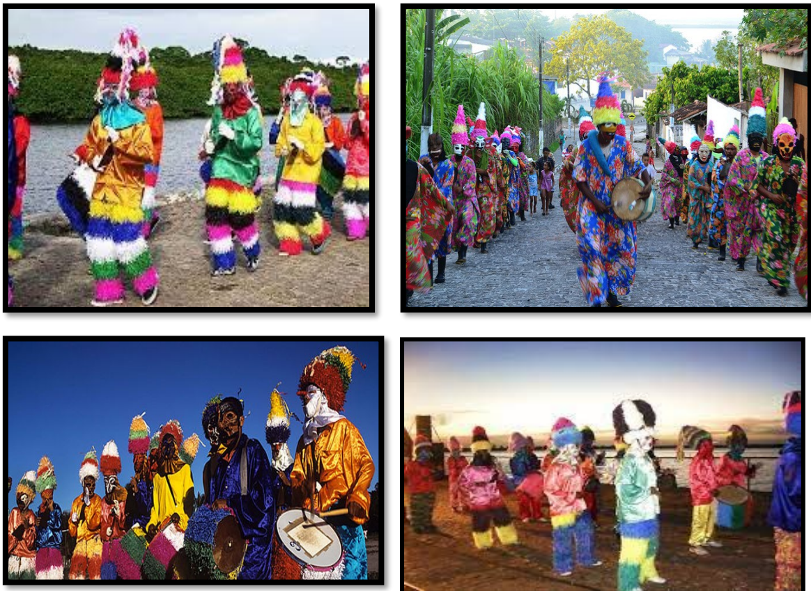
FIGURA 2: Festa da Zambiapunga

Na Vila de Paracatu do Príncipe, província de Minas Gerais, foi identificada uma folia realizada por negros, por meio de canções, danças e rezas, bem semelhante à Zambiapunga, em alguns aspectos, (Figura 2), existente na Bahia, tais como a presença específica de negros e o uso de máscaras. Obviamente, nas Minas Gerais, esta manifestação cultural passou por modificações, incorporando elementos distintos, atraindo novos participantes e relacionando-se a novas devoções como meio de garantir sua continuidade e sobrevivência (Lopes, 2007).