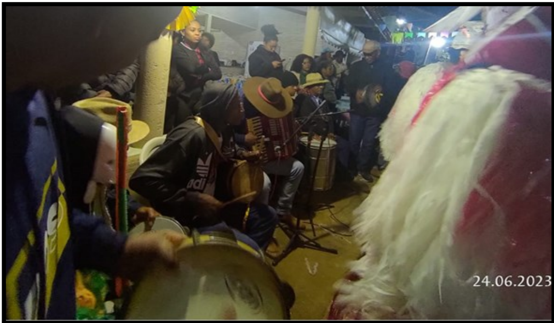
FIGURA 21: Tocadores

A Caretagem é composta por cantigas para o santo louvado e tem seis passos e cada um dura em torno de 30 minutos. Todos eles só são dançados na primeira e na última casa e, nas demais, são escolhidos dois passos para cada uma.