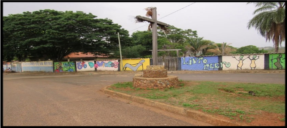
FIGURA 14: Praça do Cruzeiro de São Domingos