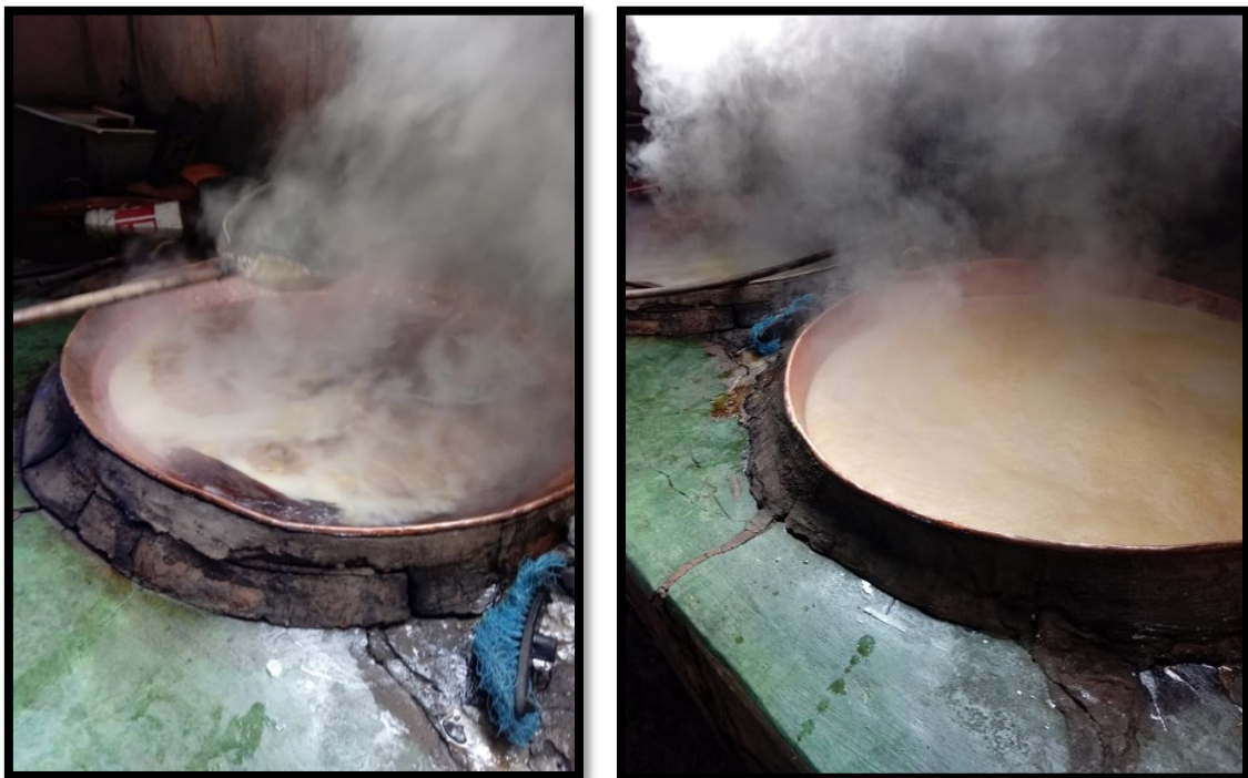
FIGURA 10: Fabricação de rapadura, batida e melaço