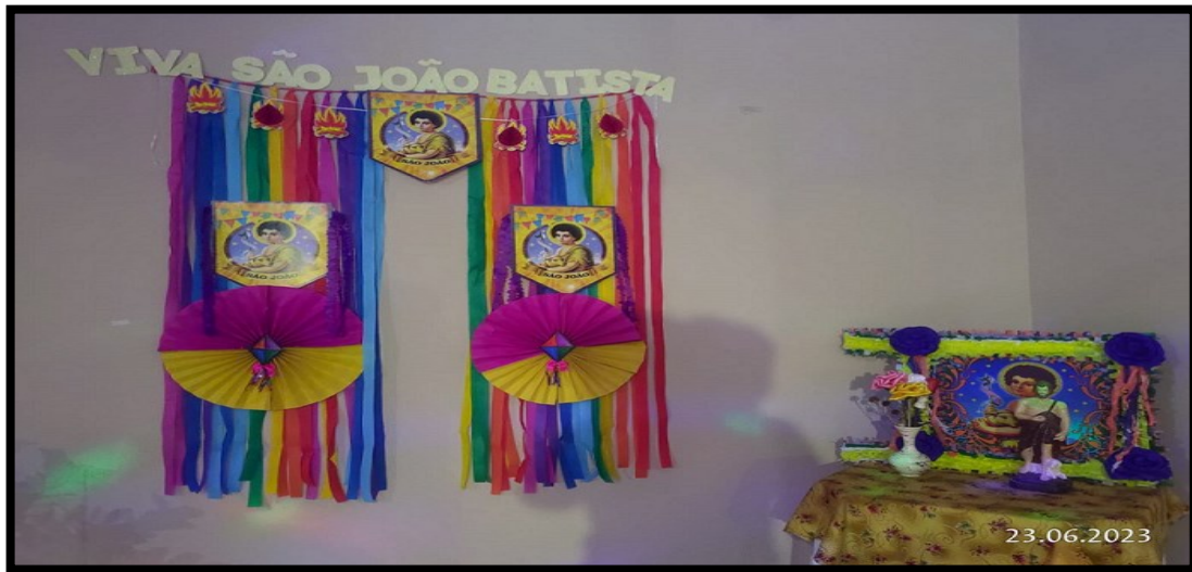
FIGURA 19: Altar em louvor a São João Batista