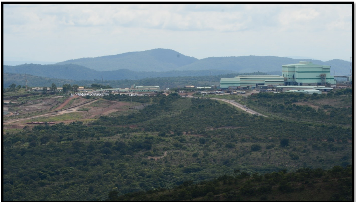
FIGURA 6: Proximidade da Mineradora Kinross à Comunidade do Machadinho

Como dito, o maior problema da Comunidade é proximidade da mineradora, que pode ser vista na Figura 6, a seguir.