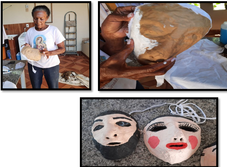
FIGURA 18: Fabricação artesanal de máscaras

Essa dança é de origem africana e sempre foi realizada na noite de 23 de junho até a manhã do dia seguinte e existem duas explicações para a festa: a primeira seria a oportunidade para os moradores do quilombo local comemorar a liberdade daqueles que ali estavam. A data foi escolhida pelo fato de que os católicos da época realizavam festejos a São João e os escravizados aproveitavam para festejar sem ser incomodados uma vez que, assim como os católicos, por ser a época mais fria do ano, acendiam fogueiras, decoravam os quintais e rezavam de acordo com a fé do grupo. O que os diferenciava era o uso de máscaras para esconder a identidade de cada um, as danças ensaiadas e a não permissão para que mulheres participassem das danças. O uso de máscaras leva à suposição de que nas primeiras festas feitas pelos escravizados no quilombo, os participantes festejavam a liberdade buscando manter suas identidades em segredo para evitar represálias.