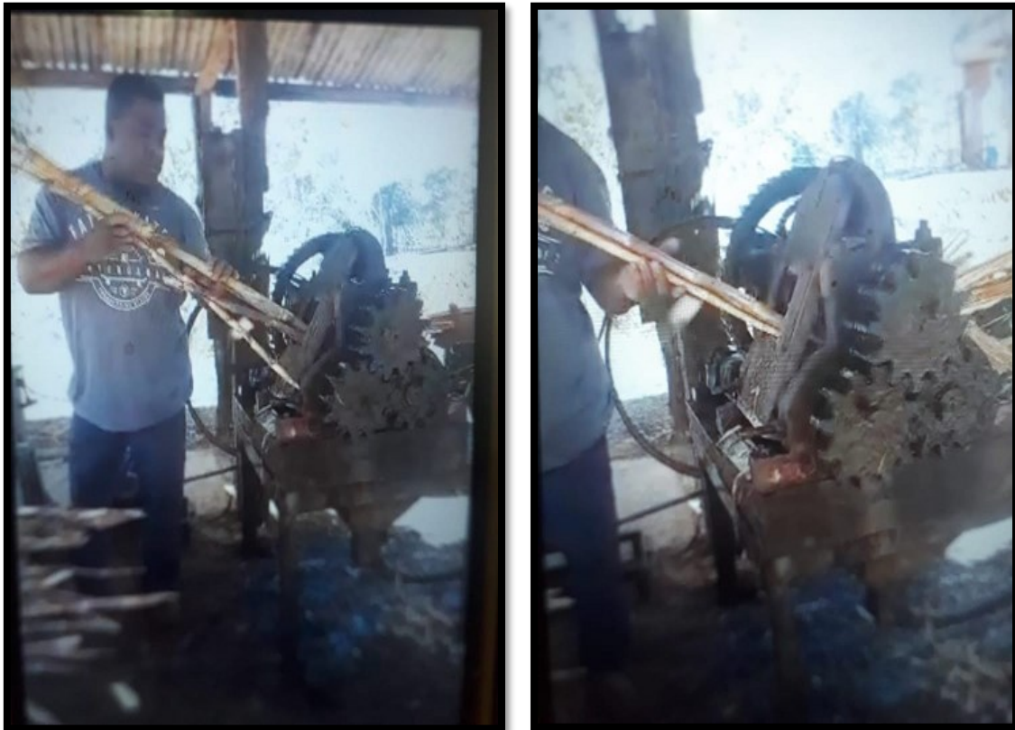
FIGURA 9: Moagem de cana-de-açúcar