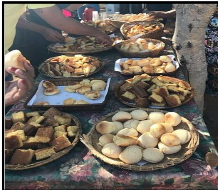
FIGURA 8: Feira de demonstração das quitandas locais

Hoje é basicamente uma comunidade rural/urbana e agrícola, pois sua população cultiva hortas, fabrica rapadura e outros derivados da cana, comercializa a culinária tradicional em um bar/restaurante local, possui pequenas plantações de milho, cana-de-açúcar e cria pequenos rebanhos de gado. Também é expressivo o comércio de açafraão-da-terra, frutas como bananas e tamarindo. Algumas moradoras realizam atividades artesanais de cestarias e produção de doces e conservas (Prefeitura Municipal De Paracatu, 2021) 4 .