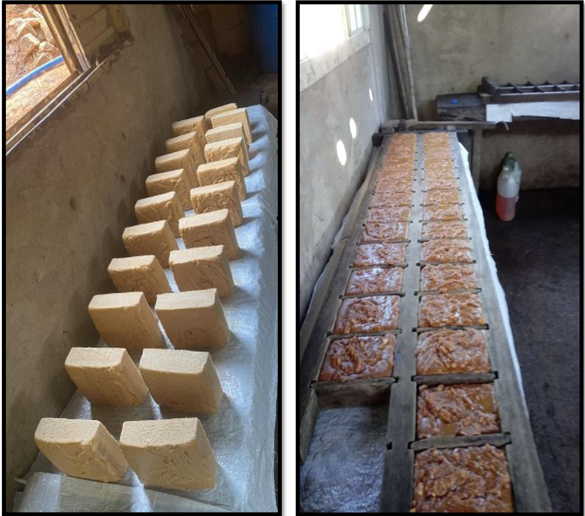
FIGURA 11: Produtos do engenho – rapaduras e batidas de amendoim