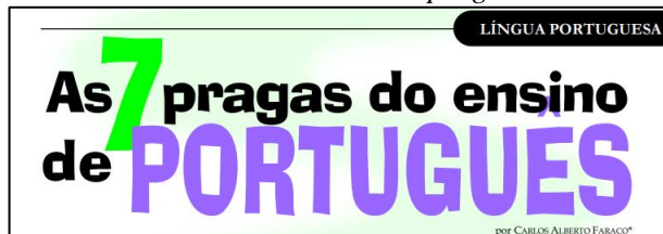
Figura 4 – Dos enunciados científicos: as 7 pragas do ensino de português