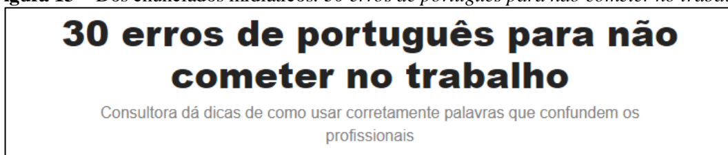
Figura 13 – Dos enunciados midiáticos: 30 erros de português para não cometer no trabalho