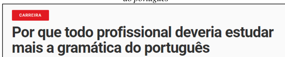
Figura 12 – Dos enunciados midiáticos: por que todo profissional deveria estudar mais a gramática do português

Os enunciados abaixo foram recortados de duas revistas de grande circulação, o primeiro, pertencente à revista Exame, veiculado na seção ‘carreira’, espaço destinado à produção de matérias que visam contribuir para a ascensão profissional dos leitores, e o segundo à revista Época Negócios , revista que trata de assuntos relacionados à economia e negócios da Editora Globo.