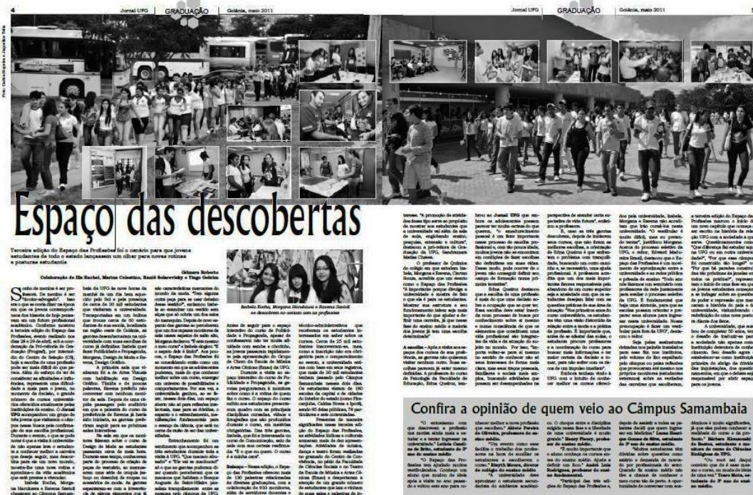
Imagem 2

A associação entre as fotos em si e com o título da matéria, “Espaço das descobertas”, justamente tenta responder ou fazer jus ao espaço em si, tanto de uma forma mais ampla, como também específica, na tentativa mesmo de mostrar a curiosidade, os olhares atentos e a interação com professores e alunos da UFG. Desta forma, a imagem que se tem, enquanto repórter, seja na produção do texto ou nas fotografias e ainda no quesito diagramação e edição da matéria, circula em torno justamente dessa dimensão de um espaço público que se abre para descobertas, para informações, para conhecimento, que será útil para os estudantes no sentido de decidirem acerca de sua carreira profissional tendo em vista os cursos de graduação oferecidos pela UFG. O que se pretende passar ao leitor/internauta, a imagem que se pretende ter do evento é justamente a dimensão do conhecimento, do espaço público, da descoberta. As fotos menores dão ao leitor a impressão de um passeio pelas diferentes salas e tentam mostrar a interação entre universidade e estudantes visitantes.