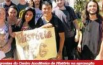
Alunos do Centro Acadêmico de História em uma reunião no Campus de Pádua, no Centro de Educação de Letras.