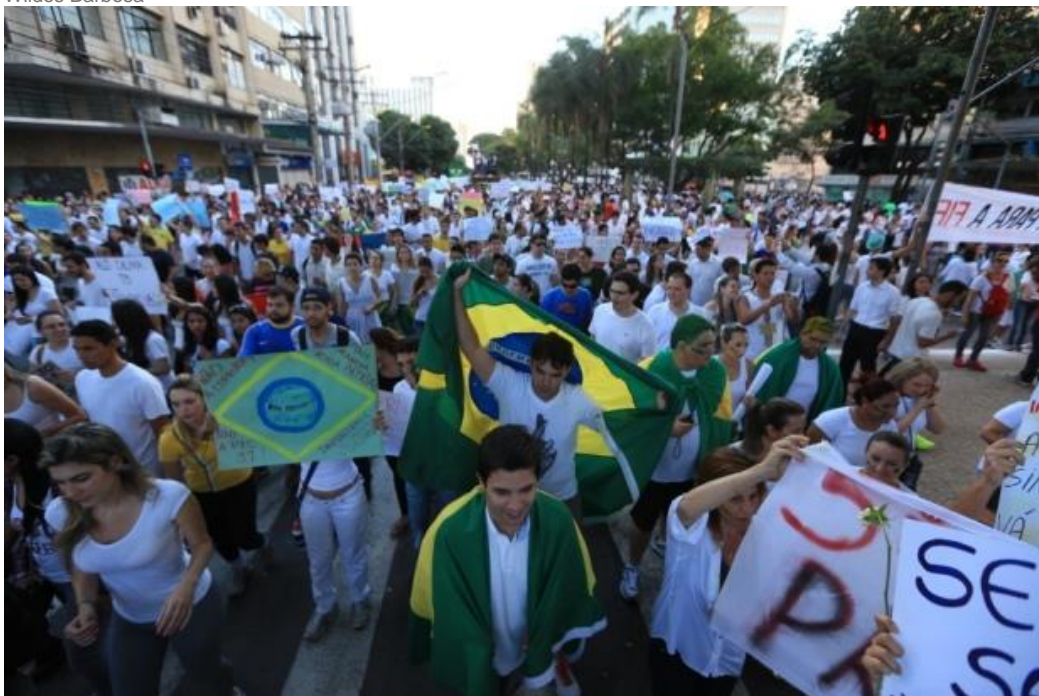
Registros do protesto de quinta-feira, 20 de junho, em Goiânia