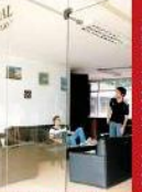
Um dos espaços do Centro Acadêmico de História em um dos seus espaços de diálogo.

Os Centros Acadêmicos são espaços de diálogo e de organização dos estudantes. Eles são espaços de encontro e de troca de ideias, onde os estudantes podem discutir e debater questões acadêmicas e políticas. O movimento estudantil brasileiro tem sido um dos principais agentes de mudança na sociedade brasileira.