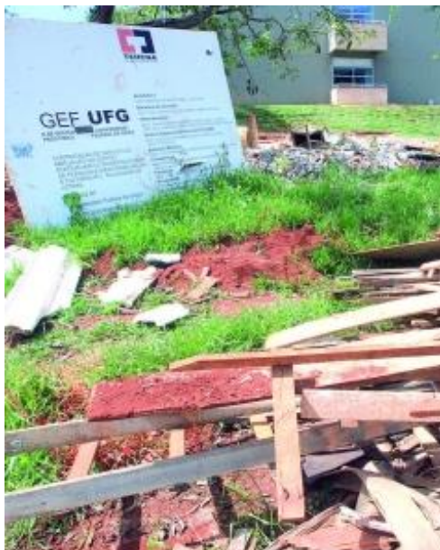
Grande número de obras tem causado transtorno na UFG

Imagem 3 – Fonte: O POPULAR, 21 de maio de 2012.