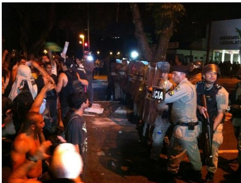
Imagem 7