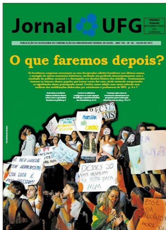
Imagem 8