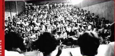
Em 1954, o movimento estudantil brasileiro se organiza em torno do MBE. A UFG participa do movimento estudantil brasileiro em 1954 e 1964, sob o comando do MBE e do CAEL.