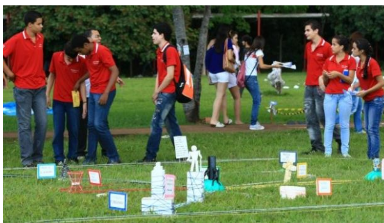
Imagem 1 – Fonte: O POPULAR, 28 de abril de 2011.

Se associarmos as palavras que destacamos presentes no primeiro parágrafo a fotografias, é possível atribuir uma percepção que vai além da palavra e do imaginário formado pelas palavras na mente do leitor. Com a fotografia, é possível trazer para o jornal e para o leitor a dimensão de uma pequena parte, uma pequena porção do local onde ocorre o evento, onde se encontra um pequeno grupo de estudantes, no qual se percebe a forma como se portam na pequena representação de um todo. A imagem abaixo não traz na reportagem nenhum tipo de legenda e procura demonstrar movimento e enfoca o público alvo do evento, complementando a informação do texto de que se trata de jovens que interagem entre si, havendo a evidência da interação também com o espaço do câmpus. A maior abordagem da matéria no aspecto verbal e visual está nas figuras humanas. O texto ressalta as impressões e reações dos jovens e a foto atesta a presença em si dos estudantes no campus. Na foto há referência a um experimento ou demonstração, que não é citada no texto da matéria e nem como legenda da foto, o que mais uma vez confirma a importância maior dada às figuras humanas. A imagem que o jornalista têm de si e do evento se encontra nesse quadro de valorização dos aspectos humanos e não institucionais. A imagem que o jornalista têm de si e do público também se encontra na valorização dos aspectos humanos, sem que se faça menção a questões institucionais da universidade.