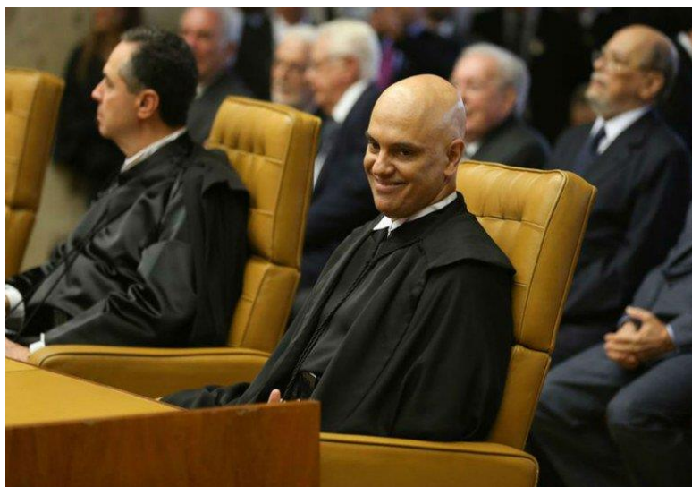
Data: 26 de março de 2017.

Imagem 14 – Alexandre de Moraes, o conservador, toma posse no Supremo