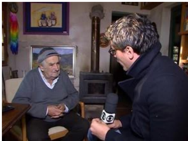
Imagem 7 – Entrevista com José Mujica, 2017.