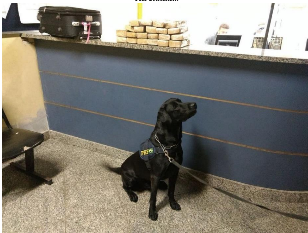
Imagem 15 – Cães farejadores auxiliaram nas buscas pela droga durante abordagem na Dutra, em Itatiaia.

Data: 25 de fevereiro de 2018.