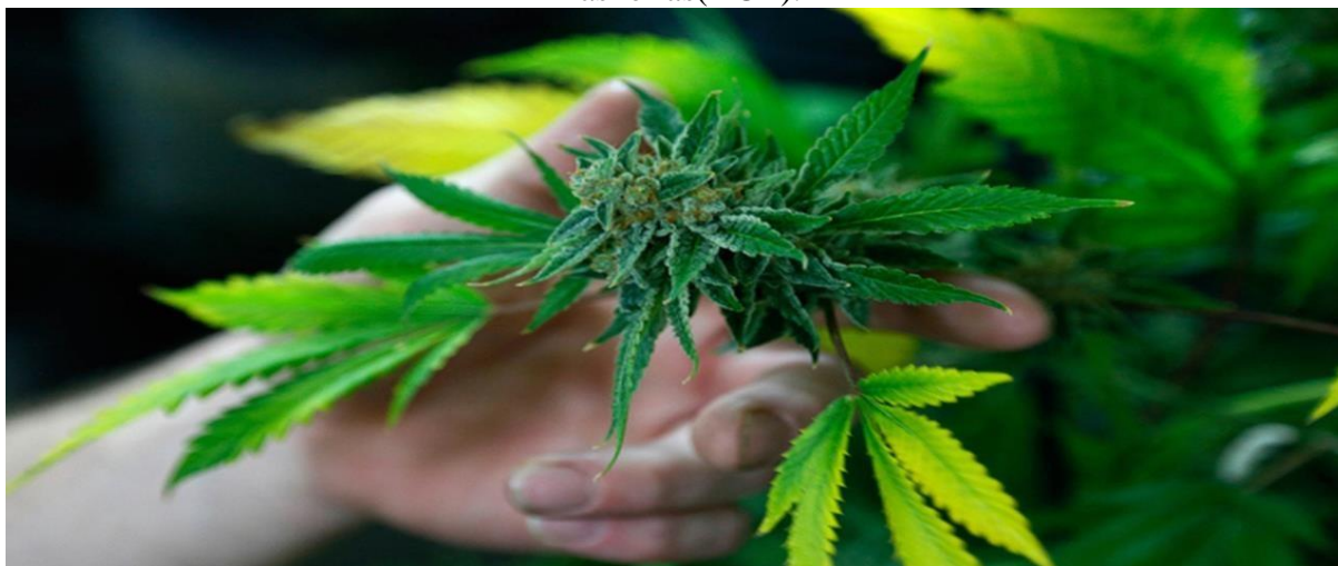
Imagem 6 - Cannabis passou a fazer parte da Lista Completa das Denominações Comuns Brasileiras(DCB).