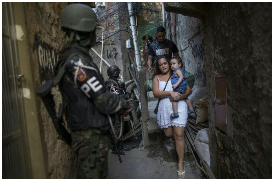
Imagem 8 - Presença do Exército interrompeu rotina de tiroteios na Rocinha, um paliativo que ignora raízes do problema.