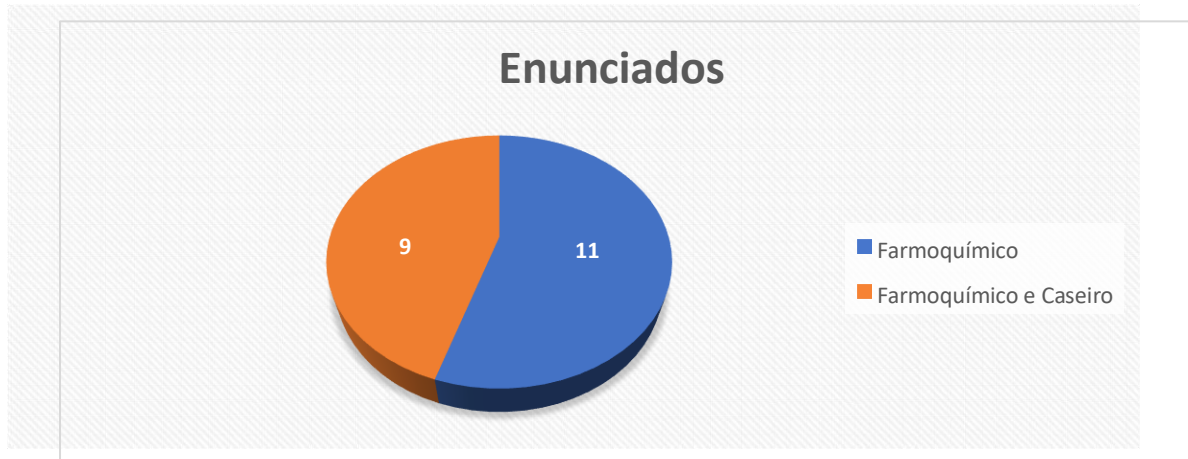
Gráfico 1 – Enunciados de cunho farmacêutico e caseiro no G1 Notícias em 2017.

lentamente, a reputação da Cannabis evolui de uma droga desprezível para um medicamento contra todos os males. No gráfico abaixo, é apresentada a amostragem dos enunciados que destacam a produção farmacêutica e caseira.