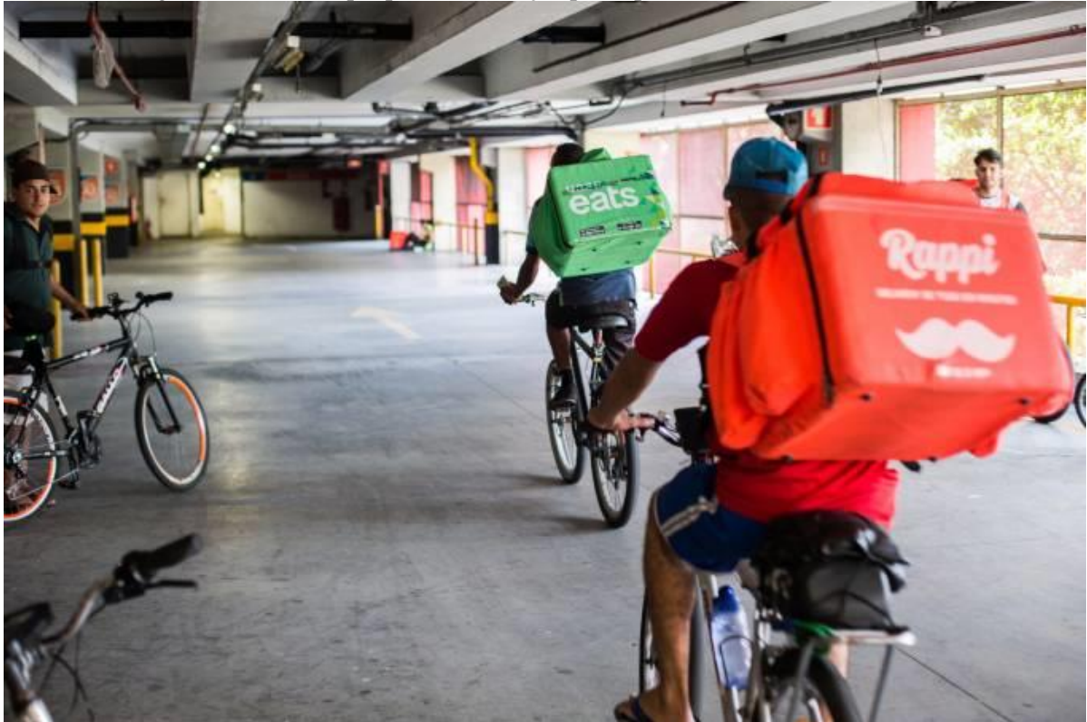
Foto 1: Entregadores-ciclistas que prestam serviços para aplicativos de comida.