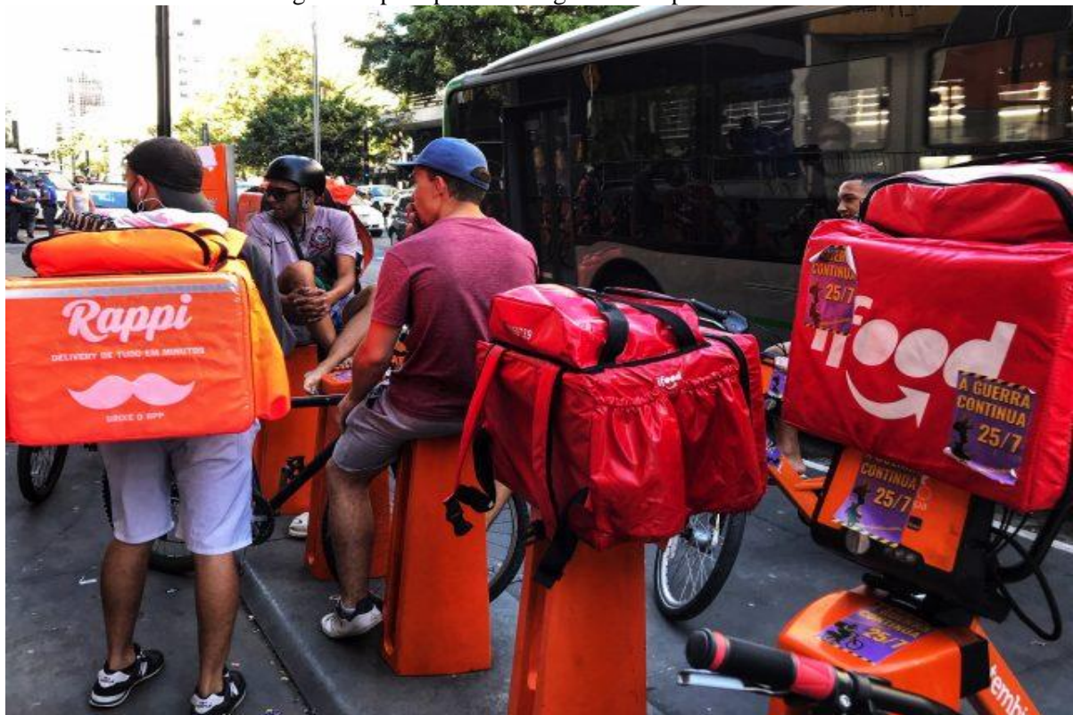
Foto 2: Trabalhadores/entregadores por aplicativos aguardando pedidos.

Conforme essa tendência, a foto 2 apresenta uma das formas de como esses trabalhadores aguardam por oportunidades de entregas.