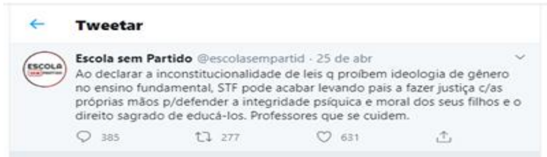
Figura 1 – Escola Sem Partido sugere que pais façam justiça contra decisões do STF