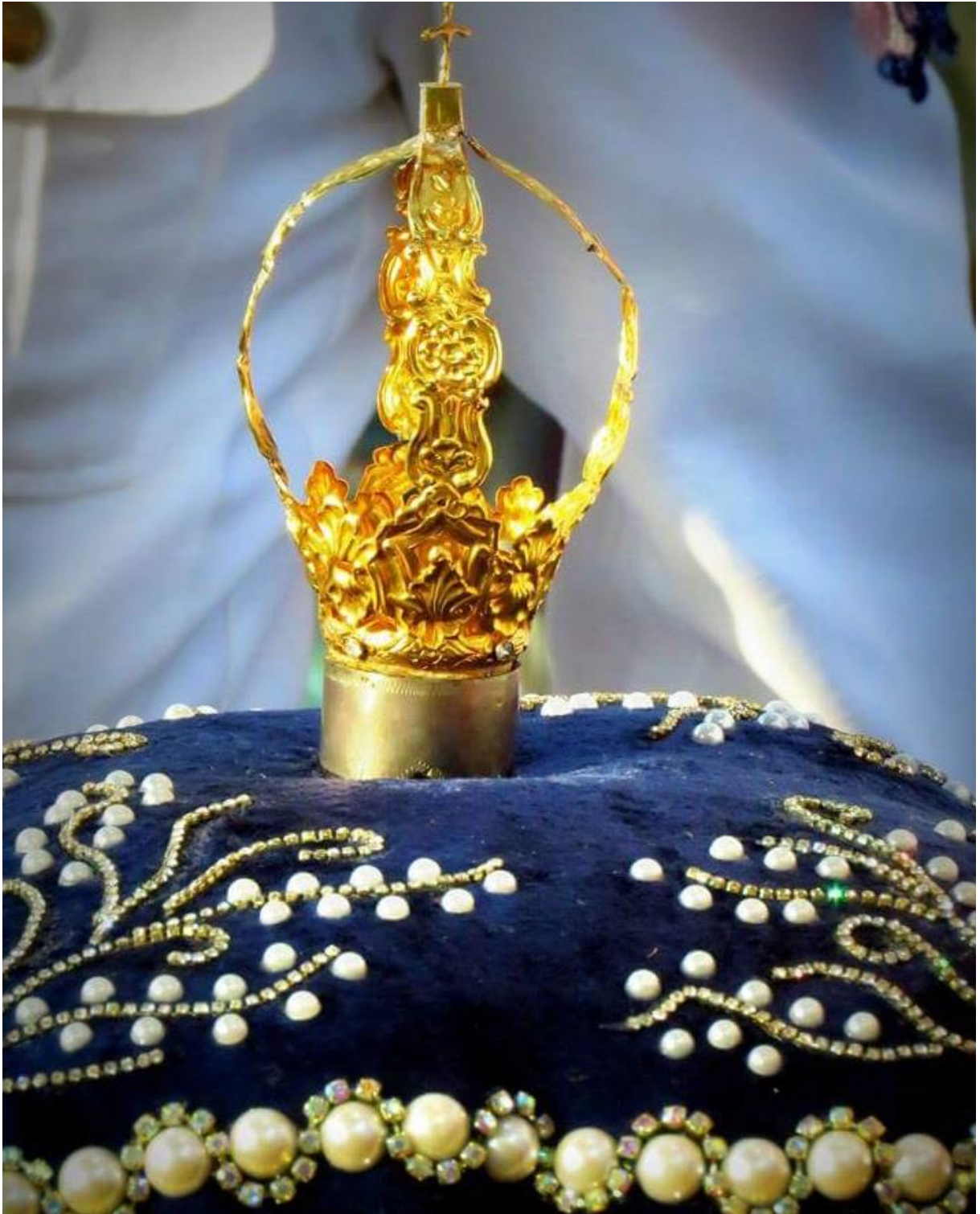
Figura 2 - Coroa de Nossa Senhora do Rosário, símbolo venerado pela Congada, durante os festejos.