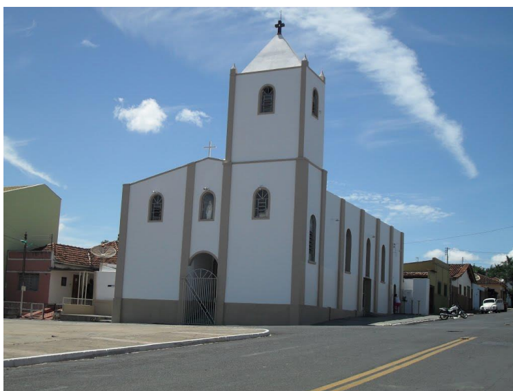
Figura 9 – Igreja de Nossa Senhora do Rosário, situada no centro da Cidade de Catalão-GO.

Hoje, a Festa do Rosário acontece numa igreja que levou anos para ser construída e que precisou de esmolas recolhidas por integrantes da Congada para ser edificada. Este foi um momento de grande importância para os partícipes desta Festa, pois mais que dançar, eles tinham o dever de conseguir donativos para que a igreja fosse construída e a Festa acontecesse em lugar fixo. A Igreja foi, para muitos, uma forma de legitimar os festejos de devoção, sobretudo frente àqueles que não a reconheciam como tal.