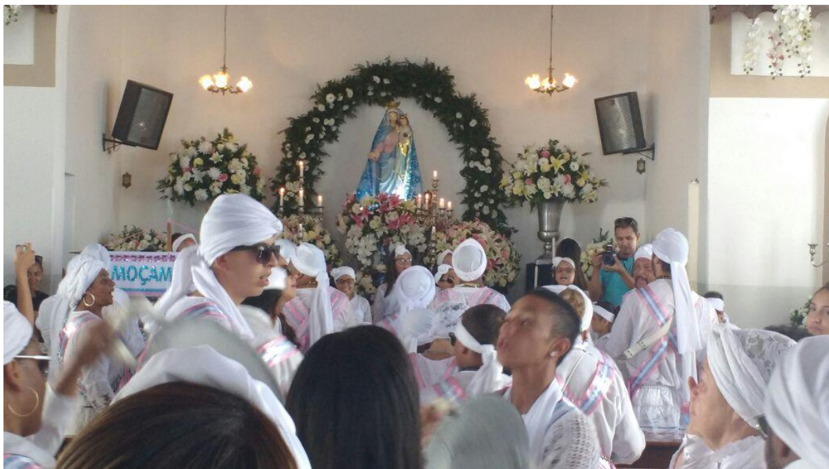
Figura 8 – Terno Moçambique Mamãe do Rosário, em evolução na Igreja.

Tomando, mais uma vez, a Festa do Rosário como uma Festa de cunho religioso, não podemos deixar de lado o sentido cômico popular e público, levando em consideração a tradição, nos dizeres de Bakhtin (1987), nas quais as narrativas e as cantigas são formas linguísticas (linguagem verbal, como discutimos no primeiro capítulo) de propagar essa tradição centenária, essa encenação pública e popular. Na cantiga “Bati Moçambique, na levada eu vou, eu vou; Oi, lá na mata, cachoeira balançô; Oi, lá invém Nossa Senhora Padroeira; Carregando nus braço um buquê de flô!”, é notório nela o refazer do mito, sendo o Moçambique que faz o seu batido simples na mata e Nossa Senhora o acompanha, carregando nos seus braços um buquê de flor, que se refere ao menino Jesus. Diante disso, compreendemos que as cantigas, como mencionamos, não distante das narrativas, são as formas pelas quais os sujeitos reavivam a historicidade do achamento da Santa do Rosário.