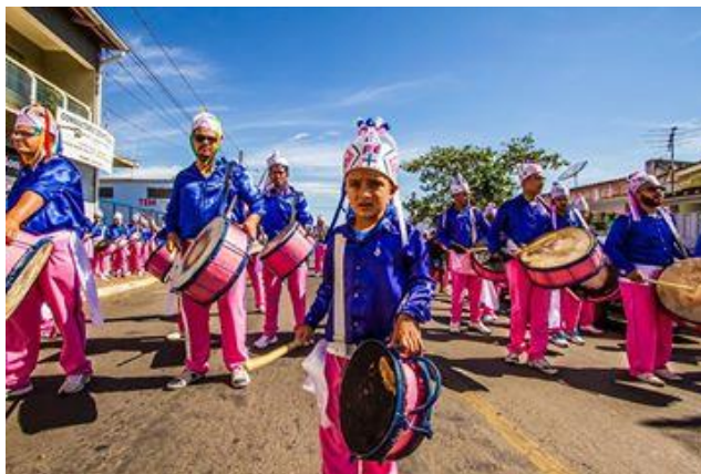
Figura 7 – Terno Congo Zé do Gordo, em evolução pelas ruas da cidade.

Criou-se o bailado da Congada, quando uma santa foi encontrada num rochedo no continente africano e vários foram os esforços para retirá-la de lá, como já foi dito anteriormente e apresentado por meio da obra de Brandão (1985). Várias pessoas e grupos (como banda musical e o Congo 14 ) foram até a santa para tentar levá-la a um local sagrado (igreja), mas foram os negros mais simples (hoje representados pelo Moçambique) que obtiveram uma eficácia diante da Santa e conseguiram levá-la para um templo.