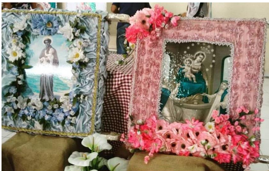
Figura 10 - Bandeiras de Nossa Senhora do Rosário e São Benedito.

Além das narrativas, algumas cantigas buscam exemplificar o momento de condução das bandeiras para o seio da Festa, fazendo com que sistematicamente compreendamos o sentido do reforço do mito. Uma dessas cantigas diz que “Hoje é dia, hoje é hora levá a bande[i]ra de Nossa Senhora [...] Puxá, puxá, puxá bande[i]rá, puxá, puxá, puxá bande[i]rá”. Por meio das cantigas e dos relatos dos narradores compreendemos, neste ato de conduzir as bandeiras, a necessidade de a Congada refazer os rituais do mito. São eles que, repetidamente, confirmam e legitimam o enredo e justificam a fé e a centenária Festa do Rosário.