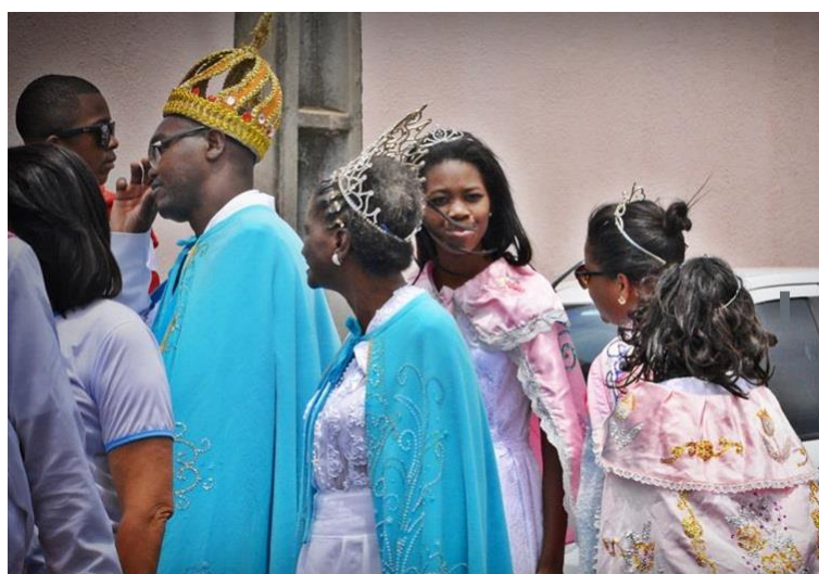
Figura 6 – Reinado de Nossa Senhora do Rosário, em cortejo pelas ruas da cidade.

Vale ressaltar que o Reinado, diante da Festa de Nossa Senhora do Rosário, mais precisamente a partir do ano de 1975 se tornou figurante dentro da festividade. Pois como nos elucidava Brandão (1985, p. 43, destaque do autor) que “o rei é um figurante , como temos visto. Ele atua como o personagem do seu próprio ritual”. Assim, seguindo o enalço das palavras do autor, é notório que o Reinado (principalmente o Rei), não tem “voz” dentro da sua manifestação cultural, pois quem tem autoridade sobre a irmandade é o seu presidente.