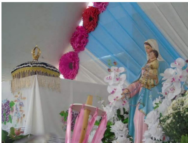
Figura 11 – Imagem e Coroa de Nossa Senhora do Rosário, presente no presbitério para a missa da Congada.

Neste dia, a cidade se alegra, pois é a Congada que vai para rua, demonstrar simbolicamente, por meio dos seus batuques, ritmos, orações e cantigas, mais uma vez a luta que o negro enfrentou para conseguir sua liberdade. Várias são as obrigações deste dia, não só o ato de festejar: a Congada tem o dever de ir até a Igreja de São Francisco de Assis, situada no bairro JK, para buscar a imagem da Senhora do Rosário, a Coroa, o Reinado, os festeiros e a comissão, saindo em cortejo, com a responsabilidade final dos Moçambiques de refazerem o ritual de retirada da imagem e da coroa, lembrando o achamento da Senhora do Rosário e reforçando o mito.