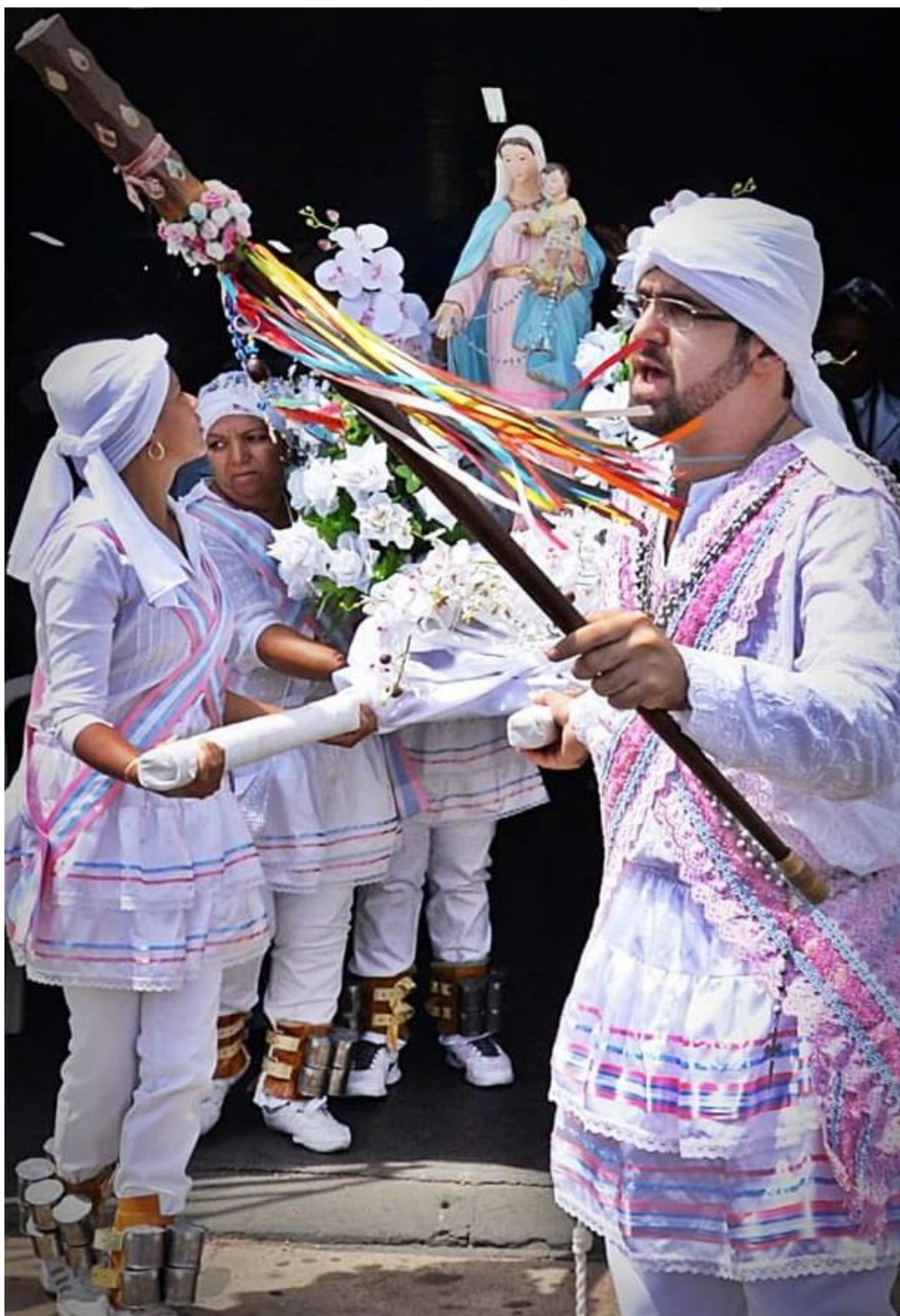
Figura 5 - Imagem de Nossa Senhora do Rosário sendo retirada da Igreja e levada para rua, nos festejos de 2015.