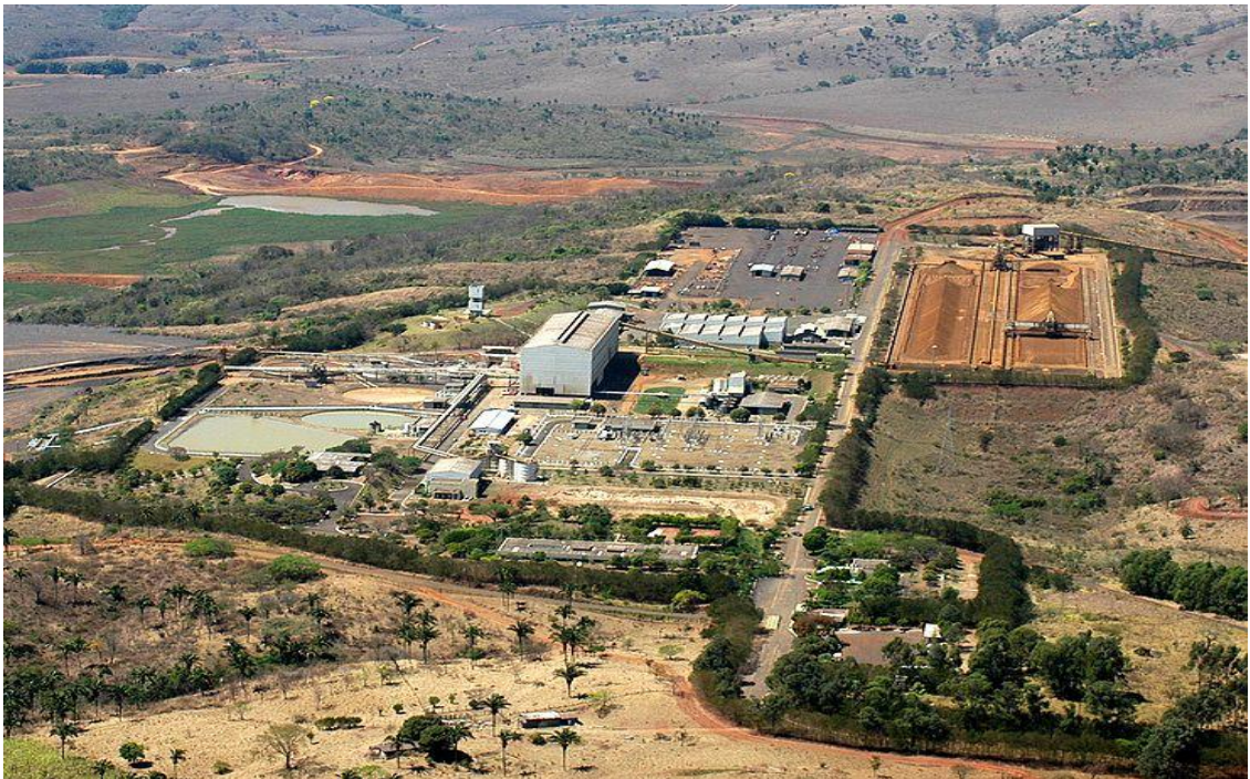
Imagem 01: Fosfertil – Leider Lincon Só, 2007.

Este fato gerou, e ainda desperta uma série de discussões e especulações a respeito dos efeitos deste processo de industrialização. Estas preocupações se destacam principalmente sobre os elementos particulados emitidos na atmosfera pelas empresas, gerando, inclusive, uma especulação a respeito da relação do alto índice de câncer registrado no município com esta emissão de elementos particulados.