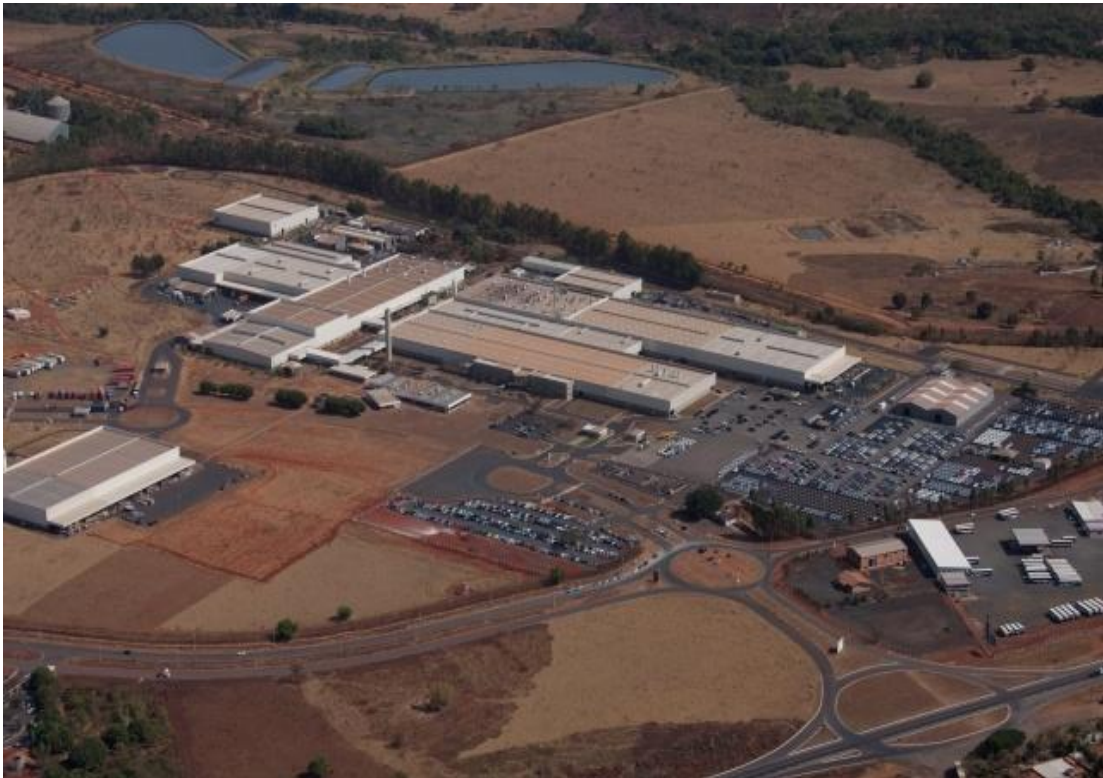
Imagem 04–Vista aérea de Mitsubishi Motors do Brasil-Catalão(GO)– www.odiário.com 2010

Diante destes fatos e da dimensão econômica que esta empresa representa, é evidente que a Mitsubishi Motors do Brasil não deve ficar de fora dos estudos que se buscam nesta pesquisa. Embora a Mitsubishi Motors do Brasil não seja tão questionada a respeito das questões ambientais do município, ela é responsável por boa parte das transformações ocorridas no espaço urbano da cidade, uma vez que representa grande fonte do capital responsável por este fenômeno. E, por isso, ela deve ser também objeto de análise deste estudo das transformações ocorridas na cidade de Catalão.