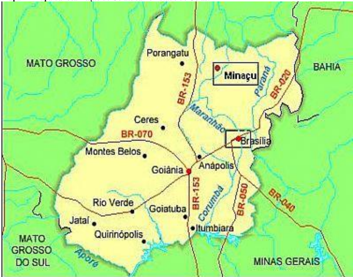
Mapa 1 - Mapa da localização de Goiatuba no Estado de Goiás.