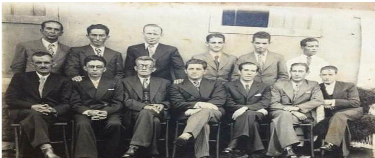
Imagem 3 - Diretoria da Fundação Ginásio de Goiatuba