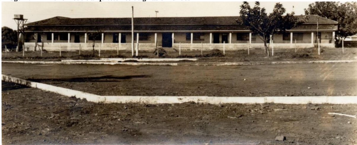
Imagem 5 - Primeiro modelo arquitetônico do ginásio - fundos