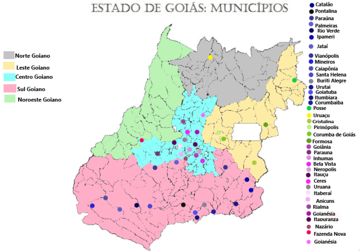
Mapa 2 - Mapa do Estado de Goiás