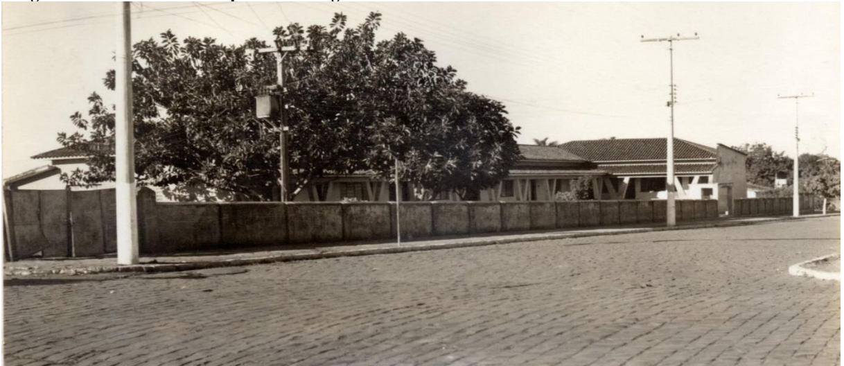
Imagem 4 - Primeiro modelo arquitetônico do ginásio - frente