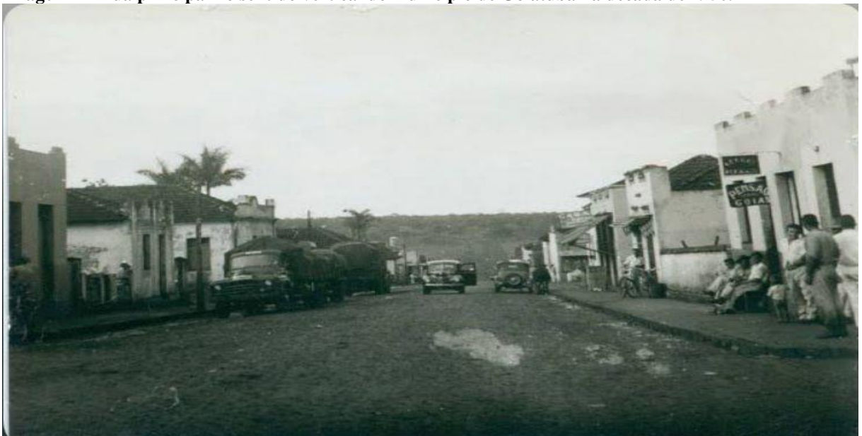
Imagem 2 - Rua principal no sentido vertical do município de Goiatuba na década de 1950.