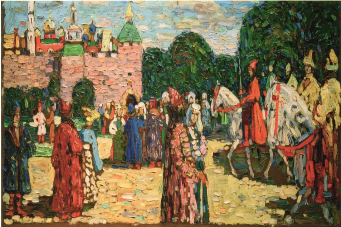
Figura 5- Wassily Kandinsky - Domingo (Rússia Tradicional), 1904. Óleo sobre tela, 17,7 x 37,4