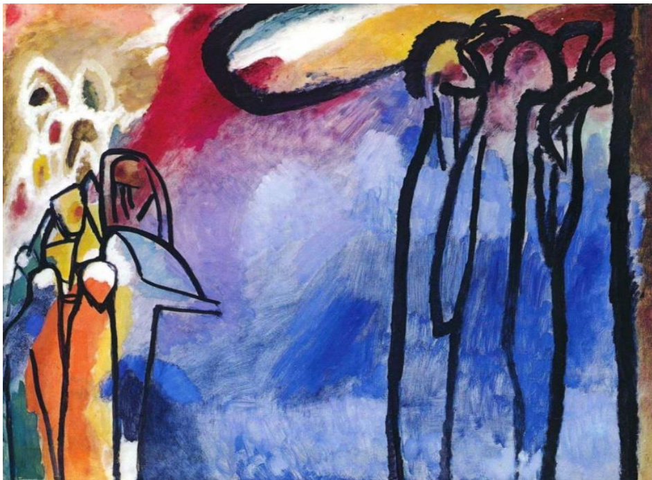
Figura 2 - Improvisação N° 19, 1911, óleo sobre tela, 120 x 141,5 cm