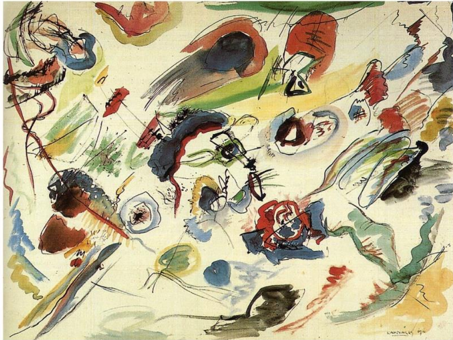
Figura 3 – Primeira Aquarela Abstrata 1910. Aquarela e Papel, 188 x 196 cm