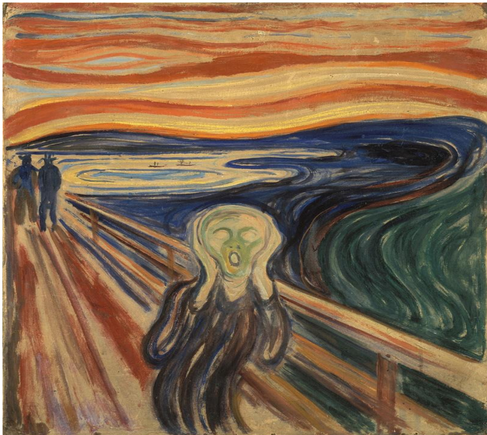
Figura 4 Edvard Munch - O Grito, 1893. Óleo sobre tela, 91cm x 73,5cm