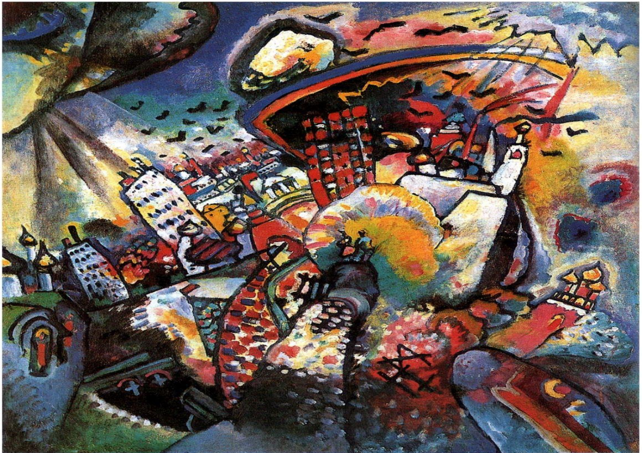
Figura 6- Wassily Kandinsky – Moscovo I, 1916. Óleo sobre tela, 51,5 x 49,5 cm