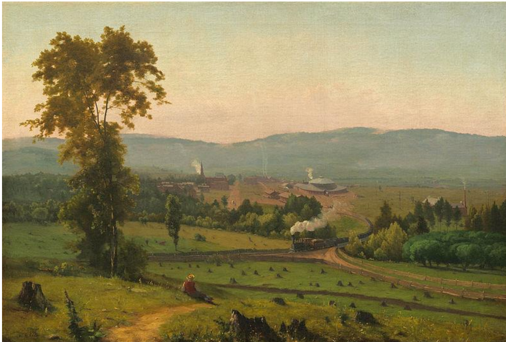
Figura 1 - O Vale Lackawanna 1855. Óleo sobre tela, 86 cm x 1,28 m