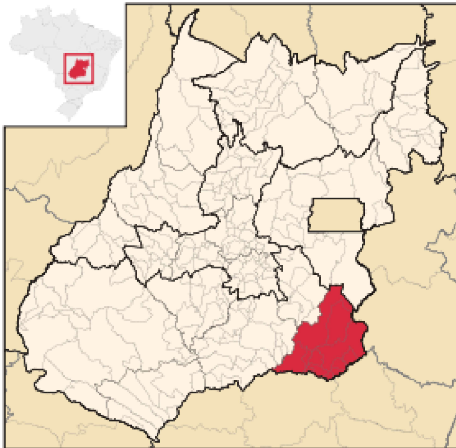
Figura 2- Mapa Microrregião de Catalão - GO

Acerca dos municípios que compõem a microrregião do sudeste do Estado de Goiás, destacamos que maior parte consiste em cidades de pequeno porte, com apenas uma cidade de médio porte. Optamos por trabalhar com a microrregião de Catalão-GO, cidade na qual se localiza nosso programa de pós-graduação em Educação.