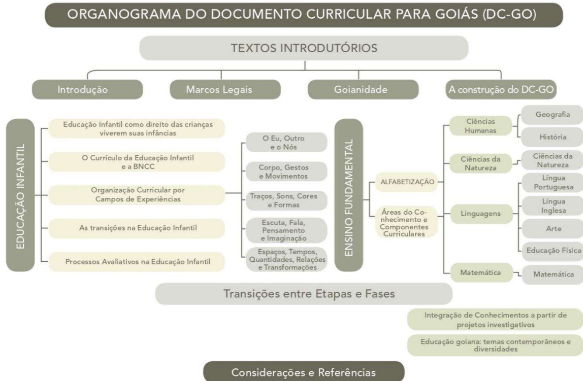
Figura 3- Organograma do Documento Curricular para Goiás (DC-GO)

O município B não possui um documento norteador das práticas da Educação Infantil. Específico. O Documento Curricular para Goiás-DCO/GO é utilizado como principal material de ordenamento das práticas dessa fase educativa, no entanto, por ser um documento amplo adotado em diversas regiões do Estado de Goiás, é possível afirmar que seu seguimento se dá de forma particular nos diferentes municípios. Esse documento foi elaborado a partir da Base Nacional Comum Curricular (BNCC) da Educação Infantil e do Ensino Fundamental.