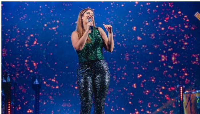
Enunciado B 54