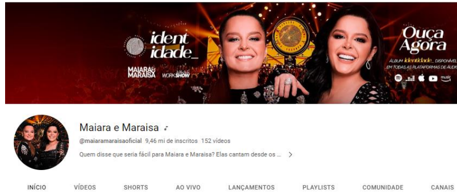
Imagem print do YouTube