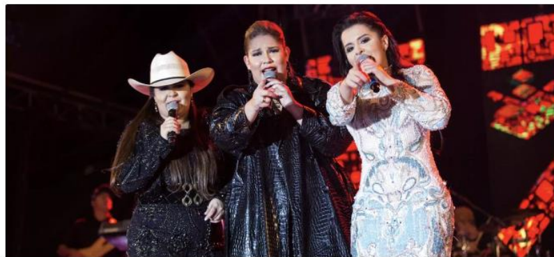
Imagem print do site Brasil 247

Nos enunciados acima, elencados conforme suas existências em um campo associado, onde se inscrevem múltiplas formas de produção e circulação do discurso do feminejo, observamos uma trama complexa que constitui uma série de formulações no interior e exterior deste discurso. São inscrições que atuam como um conjunto de formulações a partir de componentes midiáticos, comerciais e sociais, mostrando haver uma dispersão no modo como os enunciados constituem a natureza do nosso objeto discursivo. Foucault (2008a, p. 131) nos