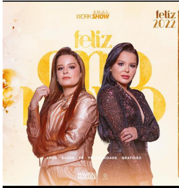
Imagem 1 46