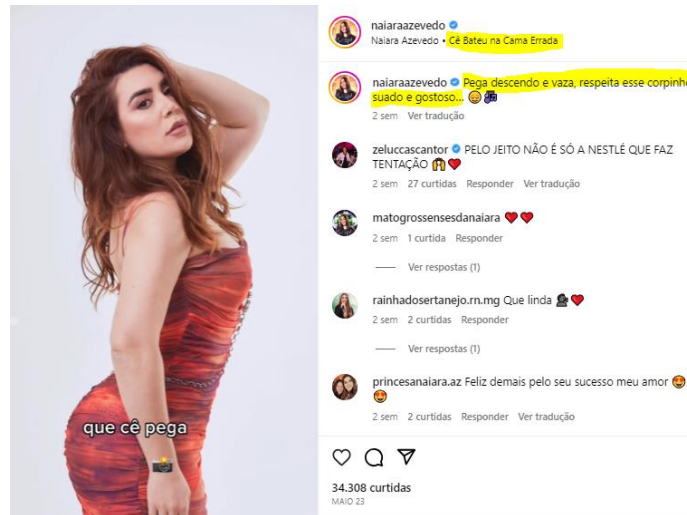
Imagem print Instagram