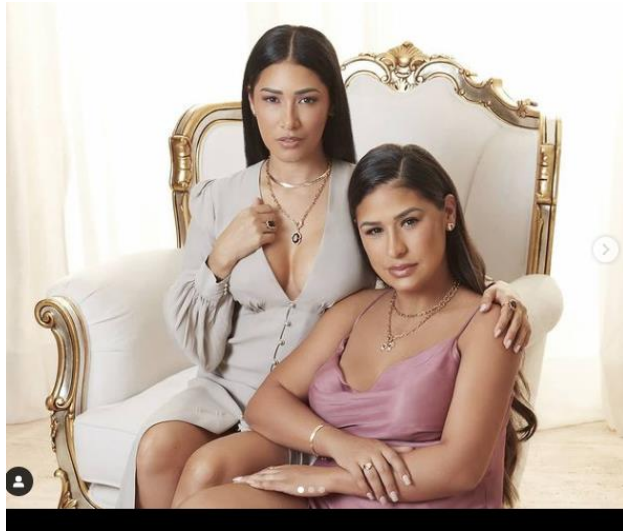
Imagem 3 48