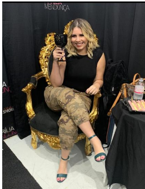
Imagem 4 49

As imagens que compõem esta série fornecem material para observarmos como o discurso de empoderamento está presente nos enunciados do feminejo, estabelecendo relações de poder e subjetivação por meio das discursividades manifestadas nos corpos que se mostram nas fotografias produzidas em estúdio, com efeitos de luz e um rigoroso trabalho de edição no