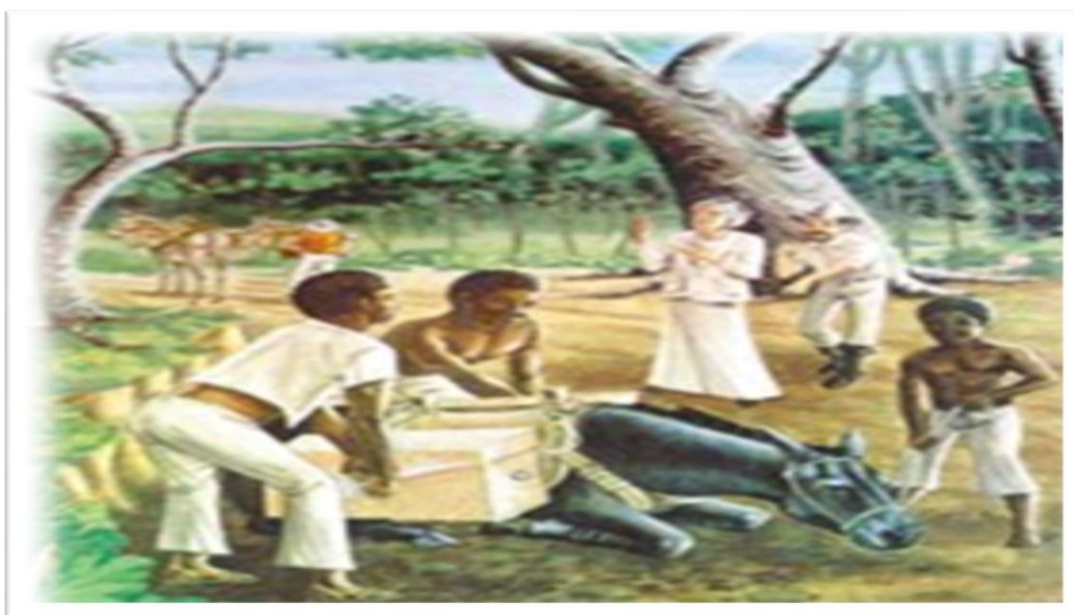
Figura 1: Formação de Anápolis

Planeando o primeiro motivo, conta a história que, em 1871 sob determinação de Gomes de Sousa Ramos, ergueu-se em construção a primeira Capela da cidade, nomeada Capela Nossa Senhora Santana, formando ao seu redor o povoado Freguesia de Santana das Antas, hoje a então cidade de Anápolis.