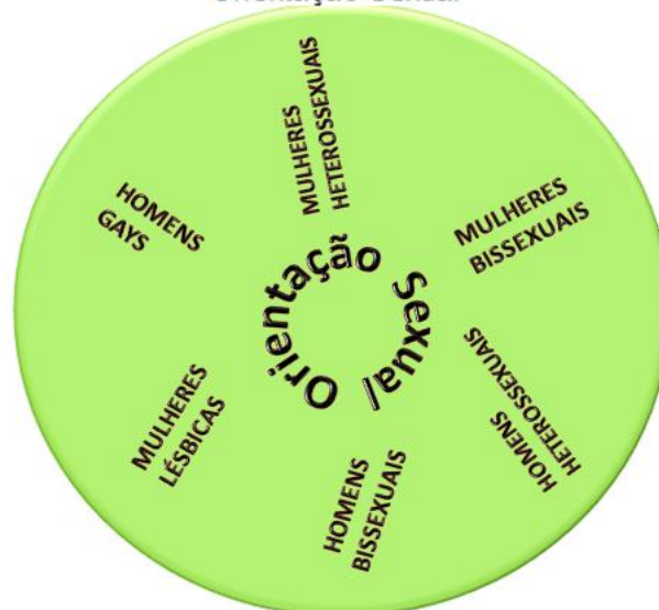
Figura 04: Círculo da Igualdade entre Orientação Sexual