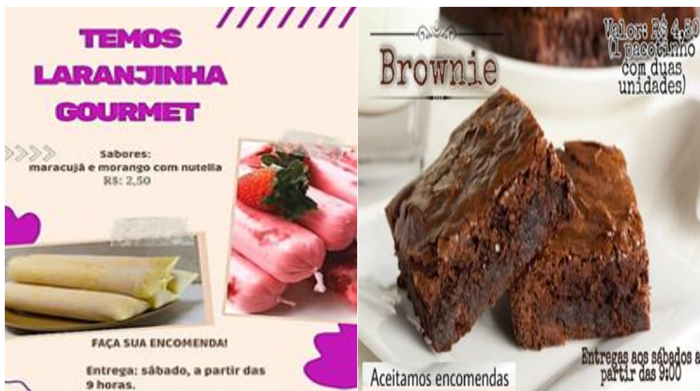
Figura 03 – Post de divulgação das laranjinhas e brownies

Os dois grupos realizaram os posts conforme a figura 3.