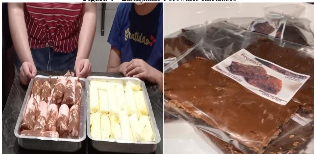
Figura 4 – Laranjinhas e brownies embalados

O grupo 1, escolheu fazer as laranjinhas na casa de um dos integrantes, e neste dia, produziram 65 unidades: 39 de morango com creme de avelã e 26 de maracujá. O grupo 2 produziu 80 pedaços de Brownies, organizados em 40 pacotes com duas unidades (Figura 4).