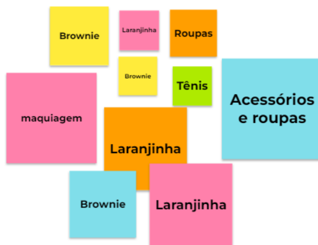
Figura 02 – Lousa digital Jamboard

Em seguida a educadora propôs um questionamento sobre qual produto eles estariam interessados em comercializar. Cada aluno fez um adesivo na lousa digital Jamboard (ilustrada na figura 2), digitando o produto de sua escolha, e depois comentamos sobre o produto que teve a maior votação.