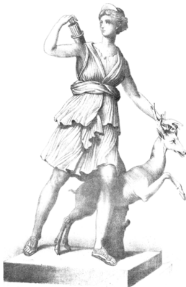
Figura 3 – Deusa Romana Diana. 4