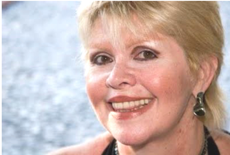
Figura 1 – A escritora Márcia Denser. 2

Exercício para o Pecado (1984), Diana caçadora (1986), A Ponte das Estrelas (1990) e Toda Prosa (2002). Além disso, Márcia Denser organizou algumas antologias de contos eróticos femininos, das quais também é coautora, como Os Apóstolos , Muito Prazer (1982) e O Prazer é Todo Meu (1984).